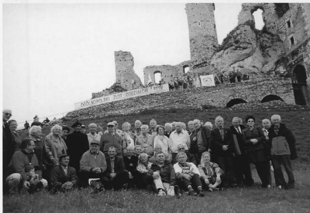
Rodzinne zdjęcie Członków Honorowych PTTK, członków władz naczelných PTTK i gości zaproszonych na Zlot