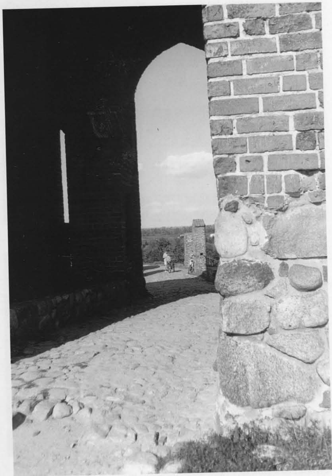
Ocalałe części dawnego zamku Książąt Mazowieckich w Czersku zdumiewają kształtem i barwą.