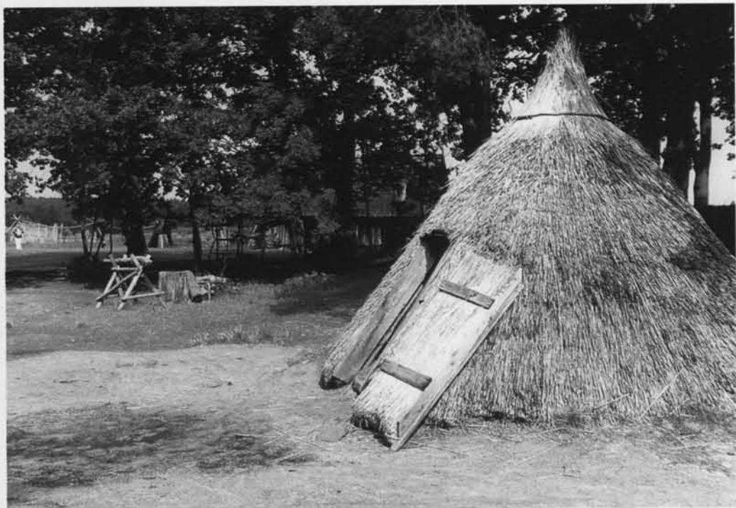
Skansen w w Klukach pozwala zapoznać się z warunkami życia i pracy słowinców.