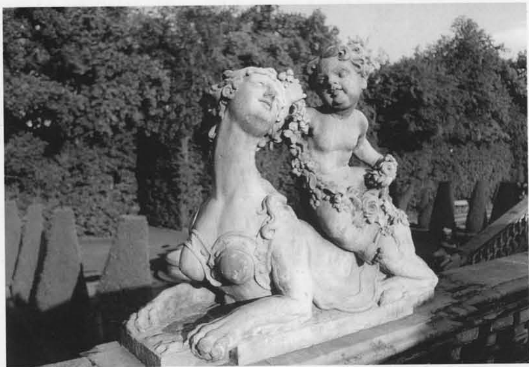
Ogrody i pomniki w Wilanowie wciąż zachwycają.