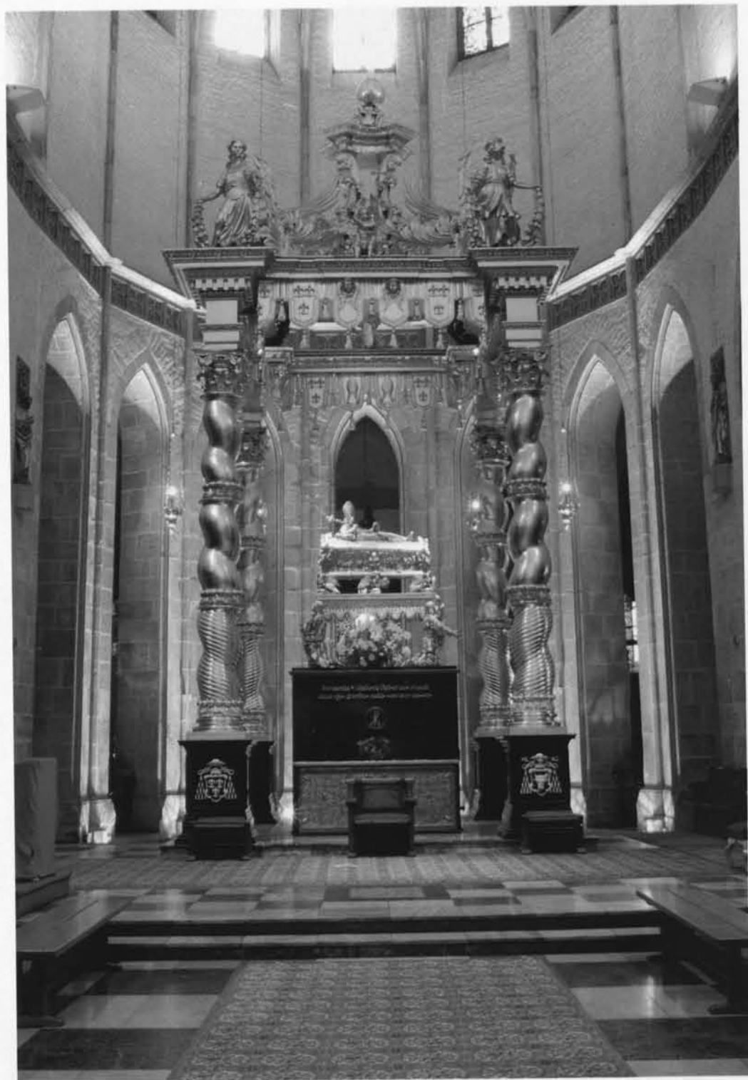
Katedra w Gnieźnie. Grób św. Wojciecha.