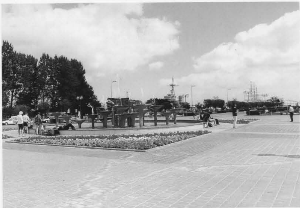
Z pięknego Skweru Kościuszki w Gdyni blisko do widocznego w tle Okrętu-Muzeum Błyskawicy.