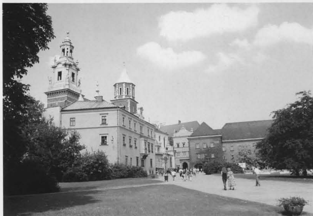
Wawel z katedrą stanowi jeden z najwspanialszych skarbów Polski.