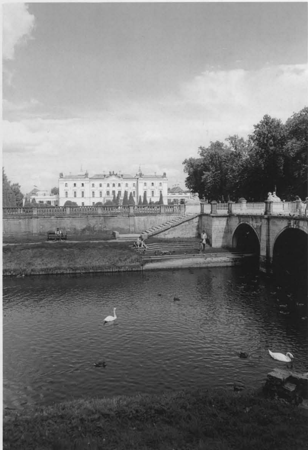
Pałac Branickich w Białymstoku nie bez powodu był nazywany Wersalem Północy.