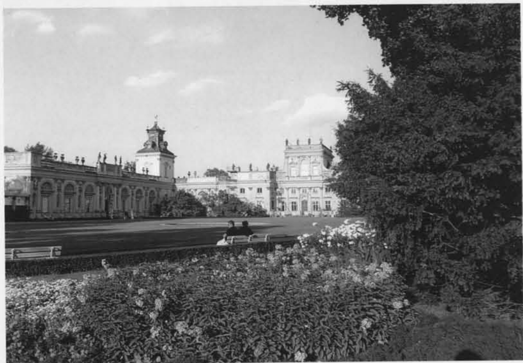
Widok pięknego barokowego pałacu w Wilanowie od strony dziedzińca.