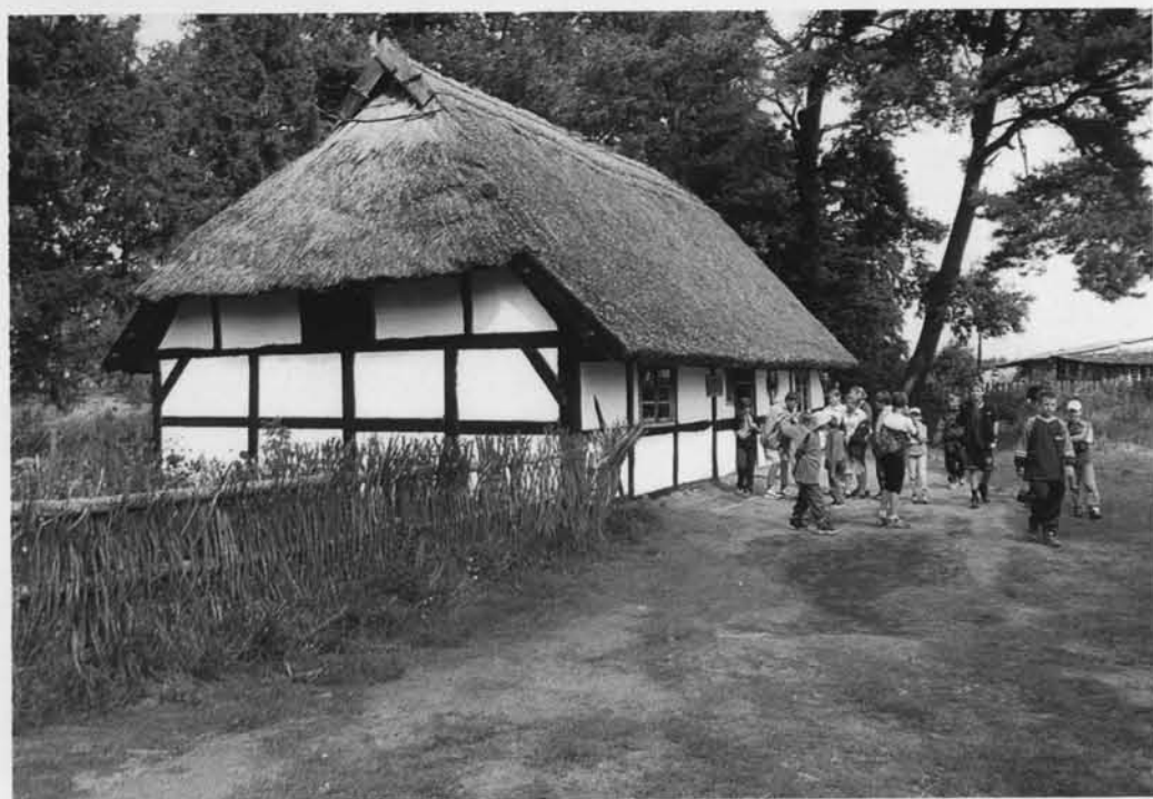
Chata w skansenie w Klukach pięknie uzasadnia powtarzane tutaj określenie o krajobrazie w kratę.