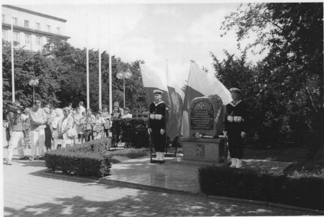
W Gdyni znajduje się Dowództwo Marynarki Wojennej. Oddział PTTK Marynarki Wojennej należy do przodujących w kraju. Warta honorowa Marynarki Wojennej RP w dniu 1 sierpnia 2000 r.