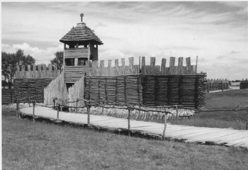
Rekonstrukcja prasłowiańskiego grodu w Biskupinie.