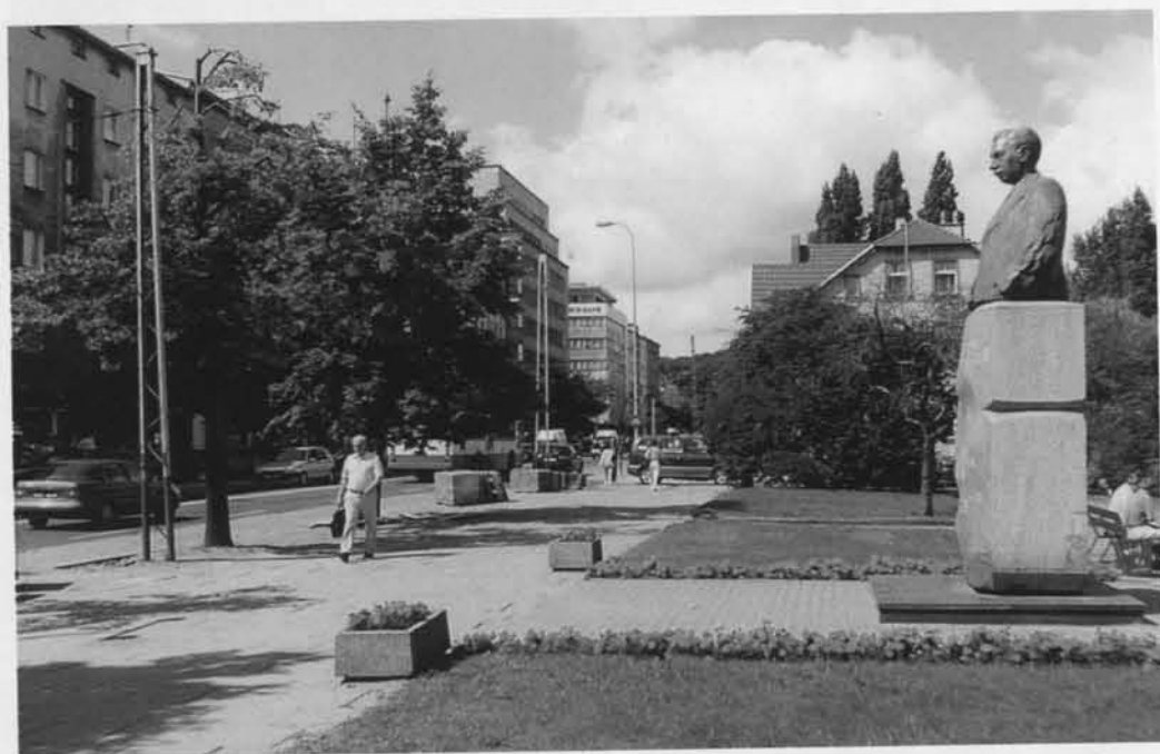
Premier Eugeniusz Kwiatkowski przed II wojną światową należał do budowniczych mocnej obecności Polski nad Bałtykiem. Po wojnie przyczynił się do odbudowy portu i stoczni. Dzisiaj Jego pomnik przypomina o znaczeniu morza dla Polski.