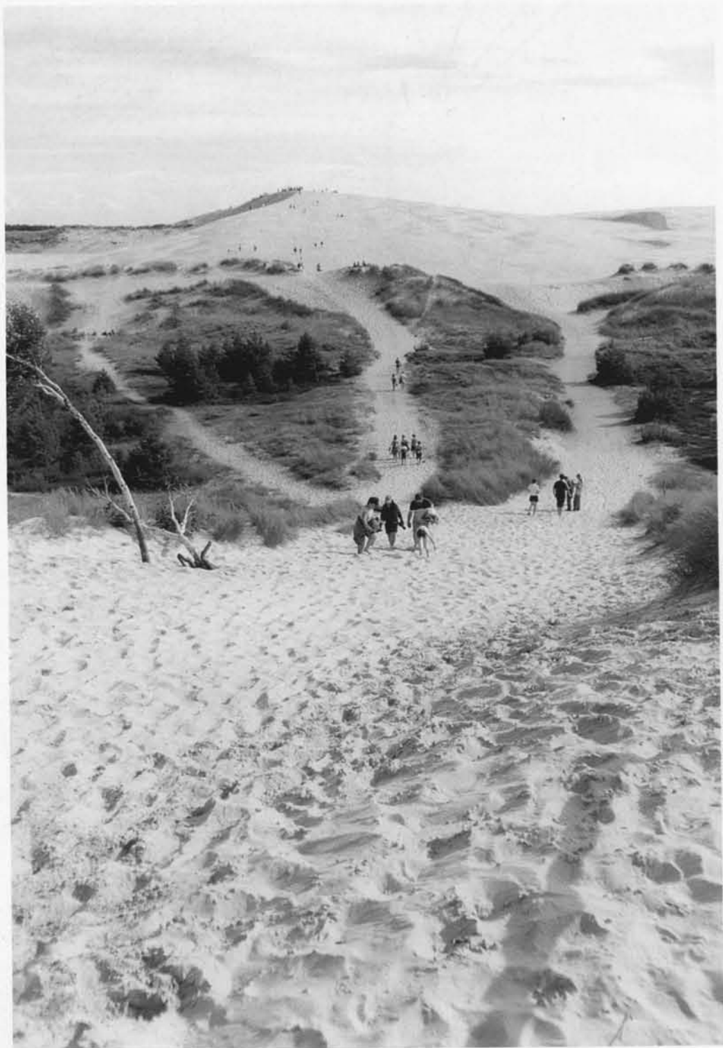
Piękno Słowiańskiego Parku Narodowego, a w szczególności wędrujące wydmy urzekły już wielu.