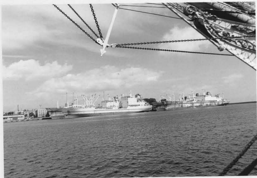
Port w Gdyni zaprojektowany przez inż. Wendę został zbudowany w rekordowym tempie.