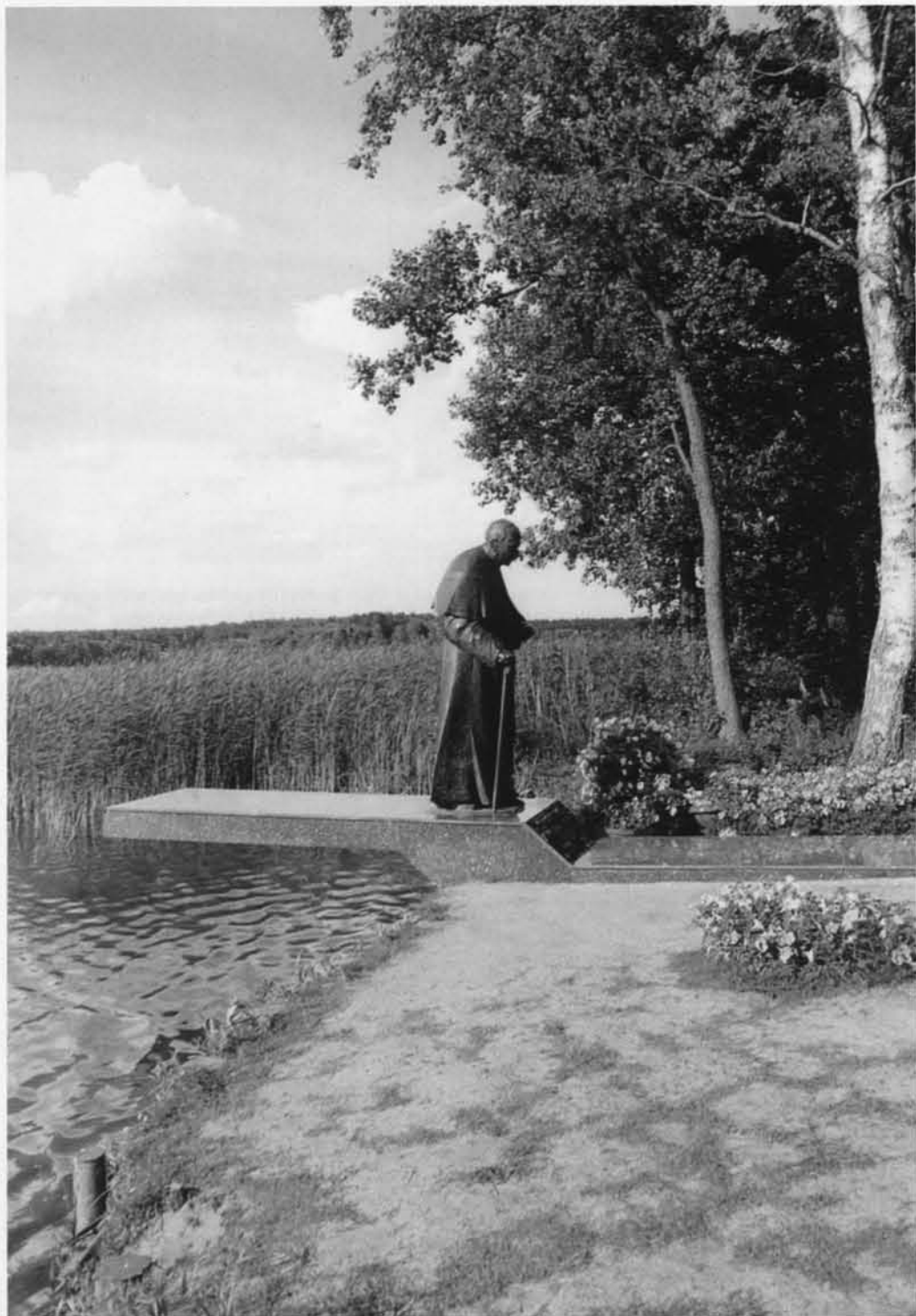
Pomnik Ojca Świętego Jana Pawła II nad Jeziorem Studzienicznym. Obecny Papież i członek honorowy PTTK często przemierzał kajakiem szlak Czarnej Hańczy.