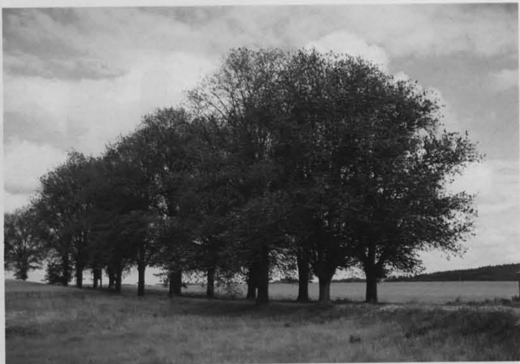
Droga w szpalerze drzew.