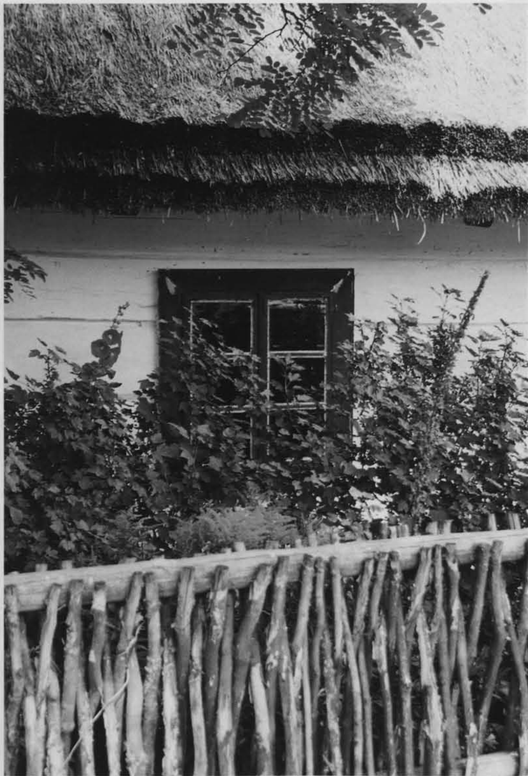
Skansen w Guciowie na Roztoczu.