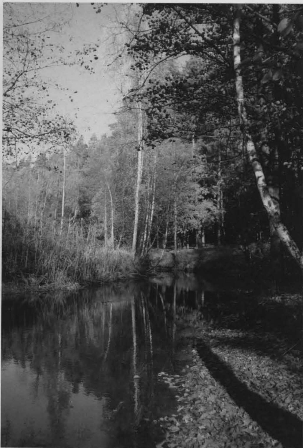
Rzeka Sapina.