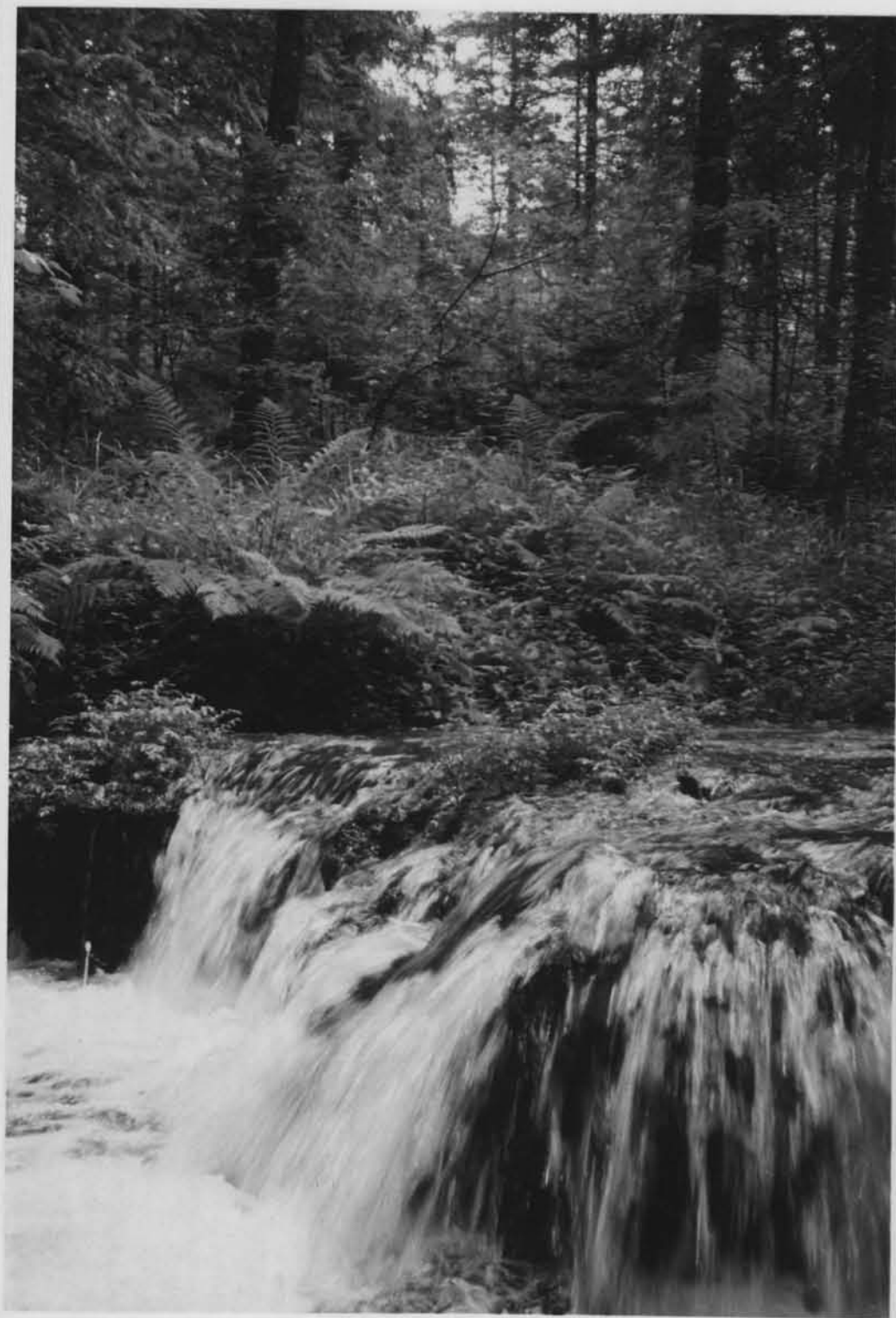
Wodospad na rzece Jeleń.