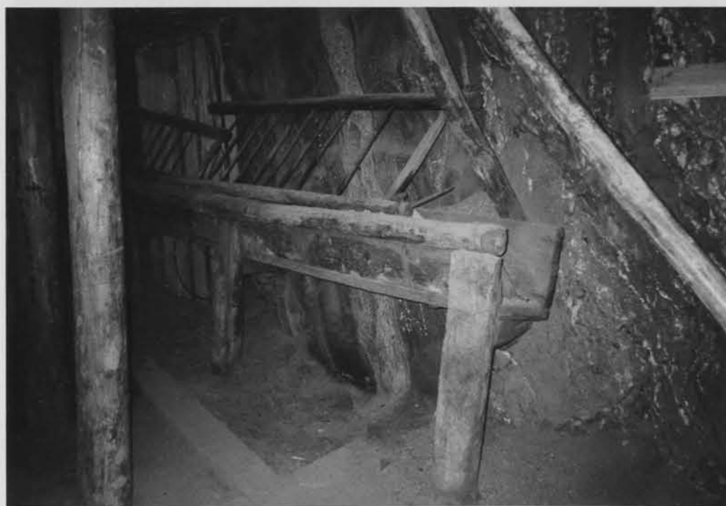
Fragment dawnej stajni w kopalni soli w Bochni.