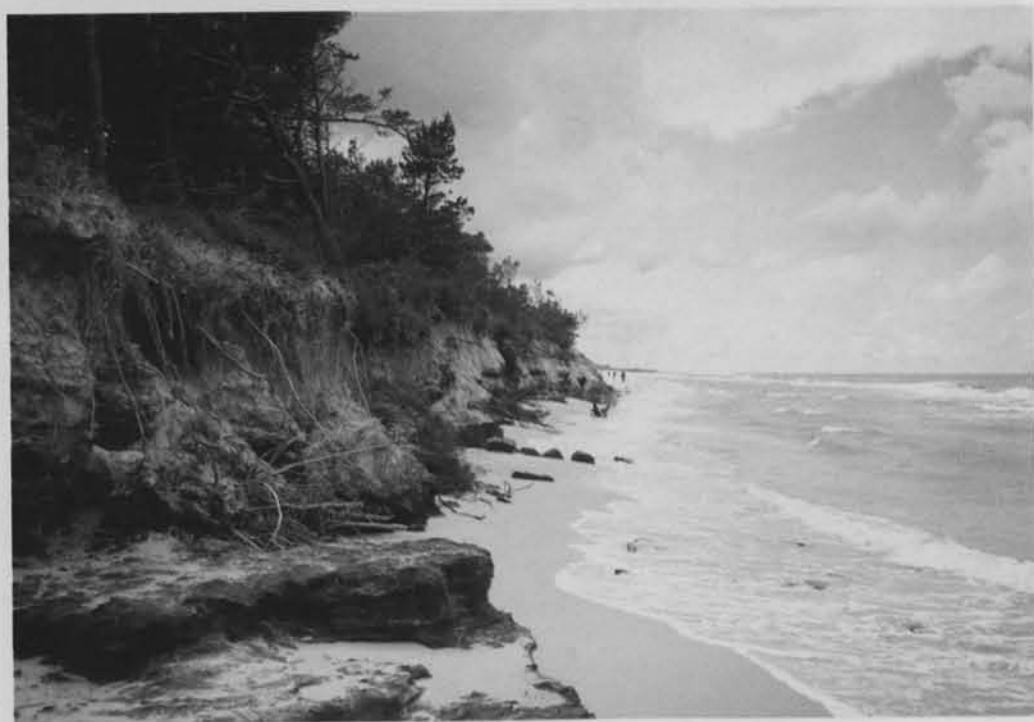
Bałtycki brzeg.