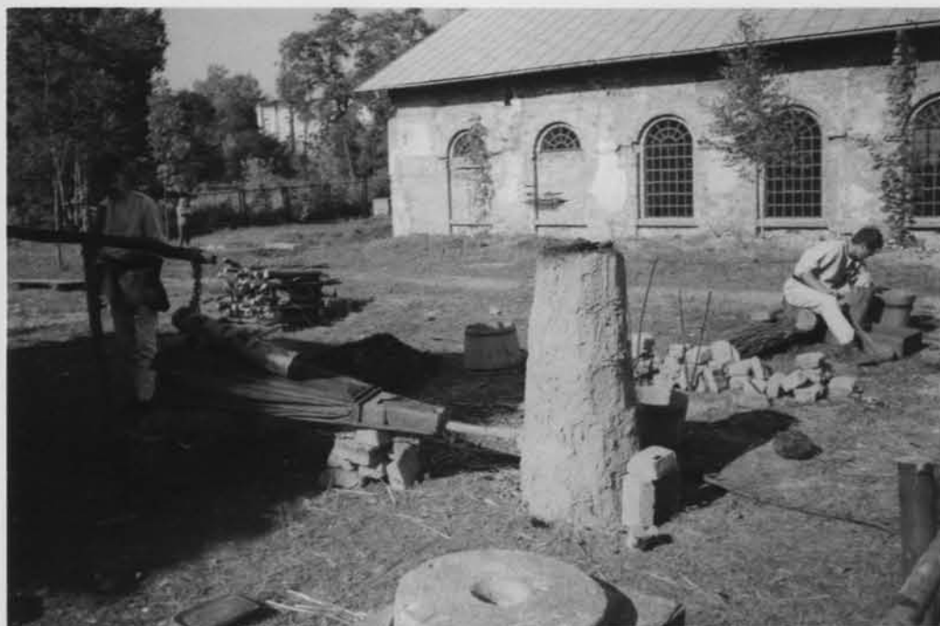
Pokazowy wytop żelaza w starożytnej dymarce w czasie festiwalu „Jarmark u Starzecha” w Starachowicach.