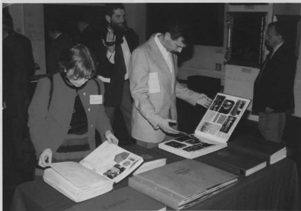
W kuluarach wystawa najlepszych kronik PTTK.