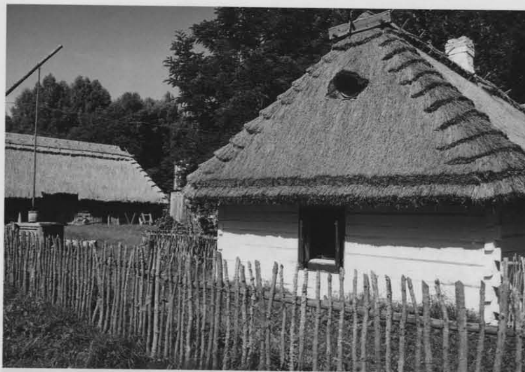
Chata w skansenie w Guciowie.