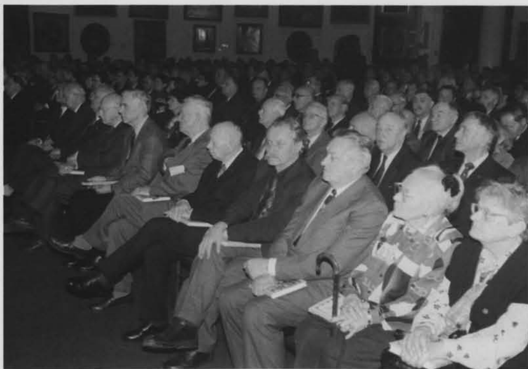
Członkowie Honorowi PTTK w trakcie głównej uroczystości 50-lecia.