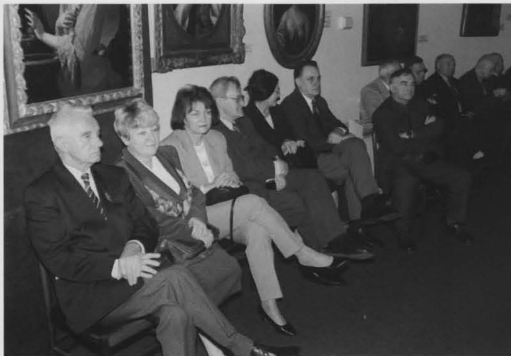
Sala Obrad. Zaproszeni byli wybitnymi działaczami PTTK.