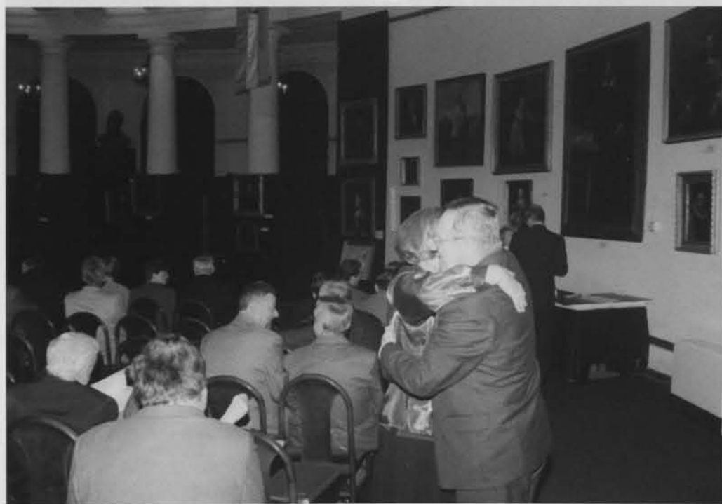
Na uroczystości spotykali i witali się serdecznie działacze z różnych stron Polski.