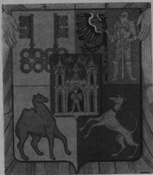
Herb miasta Pilzna

skom podziwiać przepiękny widok. Pokonawszy kraj wroga z wielkim spustoszeniem, przybyli nie zaznawszy klęski jako zwycięzcy aż nad morską toń.