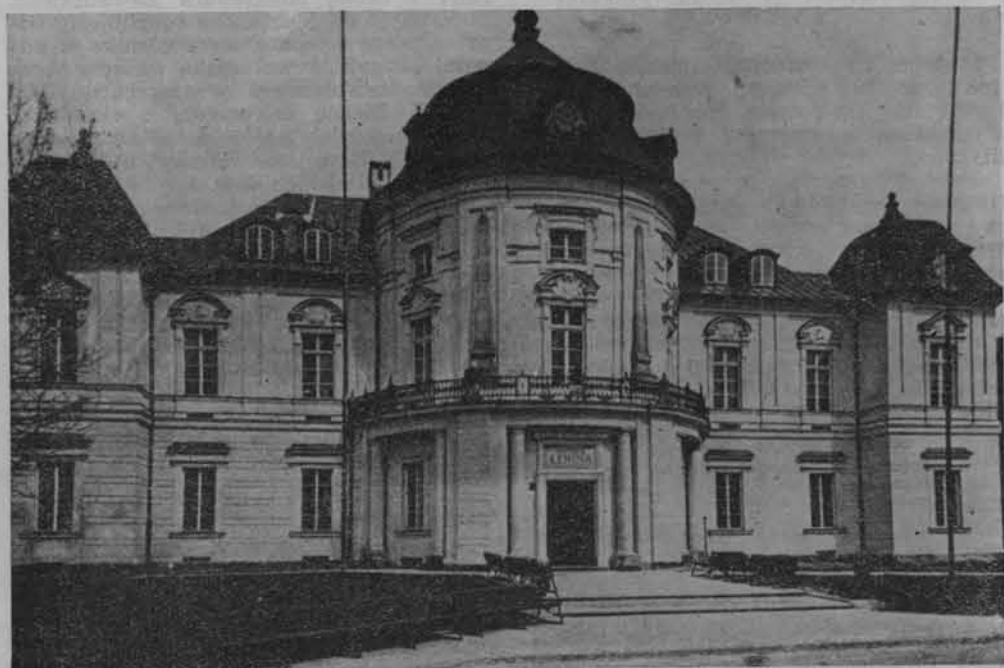
Muzeum Lenina w Warszawie. Budynek zabytkowy, dawny pałac zbudowany przez M. Przebendowskiego na początku XVIII wieku — styl późny barok

Muzeum to zostało otwarte w 30 rocznicę śmierci Lenina. Ekspozycja pt. „Życie i działalność W. I. Lenina” ma charakter biograficzny i obejmuje lata