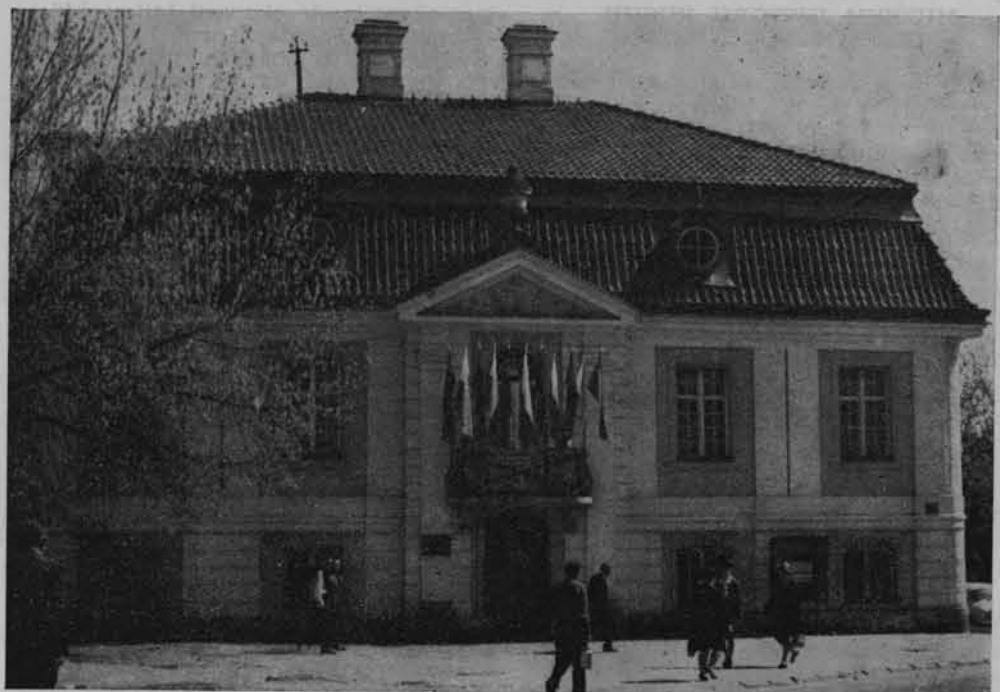
Muzeum Ruchu Rewolucyjnego w Białymstoku. Budynek zabytkowy z XVIII wieku, tzw. „Dom Koniuszego”