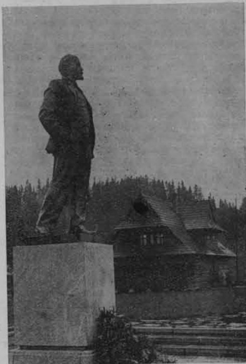
Muzeum Lenina w Poroninie — na pierwszym planie pomnik W. Lenina

Oddzielny zestaw poświęcony jest ostatnim tygodniom pobytu Lenina w Polsce. Po wybuchu I wojny światowej w 1914 roku Lenin został aresztowany przez austriacką żandarmerię i osadzony w więzieniu w Nowym Targu. Muzeum posiada ciekawe materiały dotyczące przebiegu starań o jego uwolnienie, m. in. list Nadieżdy Krupskiej pisany po polsku do socjaldemokratycznego posła w parla-