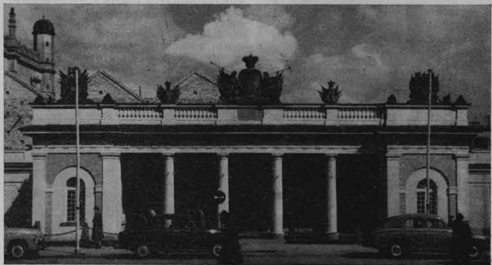
Muzeum Historii Ruchu Robotniczego im. Marcina Kasprzaka w Poznaniu. Zabytkowy odwach w stylu klasycystycznym z 1875—87 r.