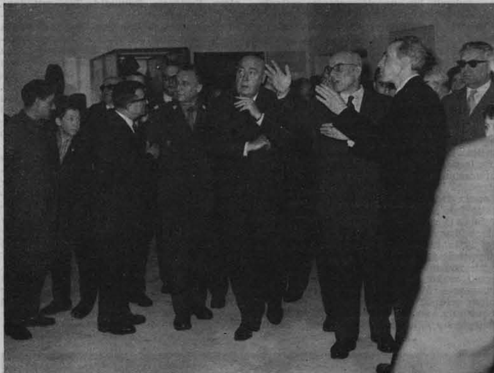
Muzeum X Pawilonu Cytadeli Warszawskiej. Otwarcie X Pawilonu w setną rocznicę Powstania Styczniowego — 22 stycznia 1963 roku