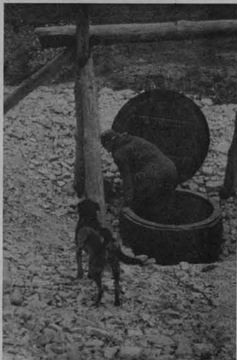
Krzemionki Opatowskie. Wjazd do szybu górniczego

świadczyło, że mamy w tej na końcu badanej jednostce górniczej do czynienia z jednym z najmłodszych wyrobisk. Wynika stąd, że systematyczne przebadanie kilku wyrobisk nie wyjawilo nam zapewne ich wszystkich odmian, jakie mogą być reprezentowane na terenie Krzemionek Opatowskich.