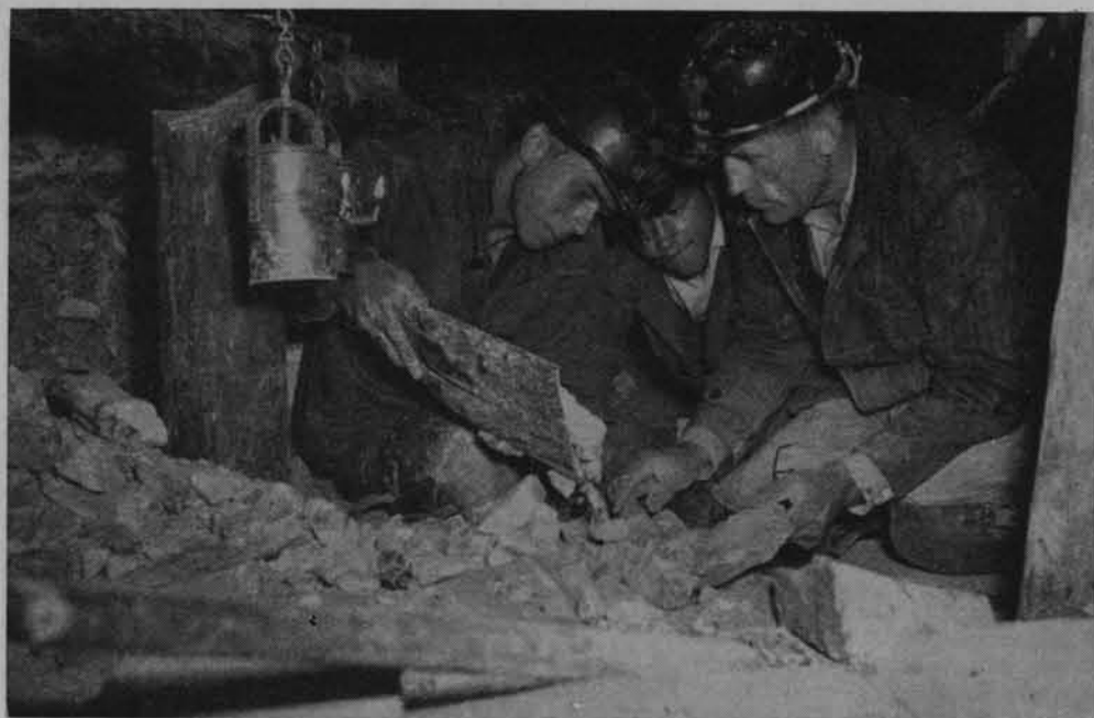
Krzemionki Opatowskie. Badania archeologiczne w chodniku podziemnym

Tak więc zarazem odkryliśmy tajemnice wentylacji i klimatyzacji metodą naturalnej wymiany powietrza. Po trzech dniach jeden z młodych archeologów zakomunikował mi, że chyba moje odkrycie nie jest takie pewne, ponieważ wróciło zimno, a i powietrze jest nie do wytrzymania — dokończył mało sympatycznym tonem.