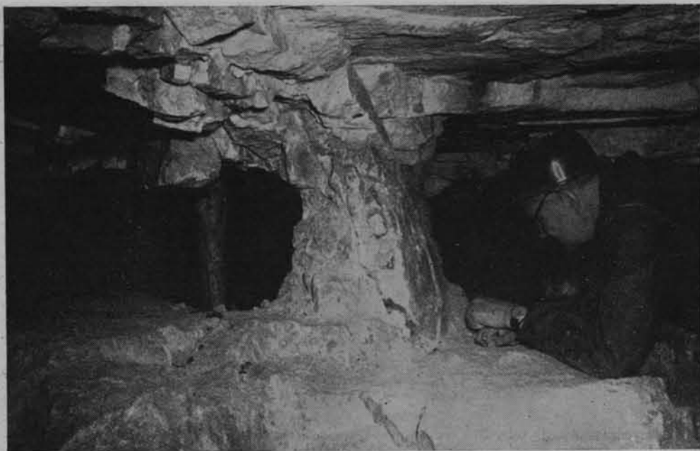
Krzemionki Opatowskie. Filar skalny

Krzemionki Opatowskie. Archeolog pokazuje miejsce, z którego neolityczny górnik wyjął bułę krzemienną małych wymiarów