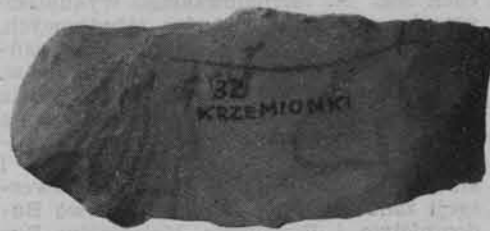
Krzemionki Opatowskie. Półwytwór siekier z surowca krzemienno-żelaznego