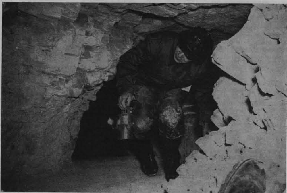
Krzemionki Opatowskie. Zwiedzanie wyrobiska podziemnego

dziesięciocentymetrową nieckę wydrążoną poniżej zalegania warstwy krzemienionośnej. Urabianie skały i wydobywanie krzemienia opisano dość dokładnie. Neolityczny górnik używał narzędzi kamiennych albo rogowych.