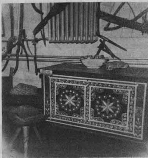
Fragment wystawy „Sztuka ludowa” w Muzeum Regionalnym w Tomaszowie Lub.

realizacji ze względu na trudności lokalowe. Projekty przewidywały utworzenie jedyne go na naszym terenie muzeum poświęconego ruchowi oporu na Lubelszczyźnie. Lokalizacja muzeum w Kraśniku uzasadniona była faktem, że właśnie tutaj, w obrębie powiatów kraśnickiego i janowskiego, znajdował się jeden z najważniejszych ośrodków walk partyzantskich z okupantem hitlerowskim.