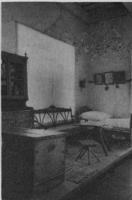
Fragment ekspozycji etnograficznej w Muzeum Regionalnym w Krasnymstawie. Wnętrze chaty wiejskiej.

Zrealizowano również projekt utworzenia muzeum w Kazimierzu nad Wisłą, na którego cele przeznaczono zabytkową kamienicę mieszczańską z początku XVII w. tzw. Celejowską. W muzeum poza stałą ekspozycją z zakresu sztuki ludowej Powiśla organizowane są wystawy czasowe. Ze względu na to, że Kazimierz jest jednym z najpiękniejszych ośrodków zabytkowych i turystycznych Lubelszczyzny, skupiającym w sezonie letnim wielu artystów-malarzy, muzeum rozpoczęło gromadzenie zabytków ikonograficznych w postaci zbiorów artystycznych (grafika i rysunki) o tematyce związanej z miastem i jego zabytkami.