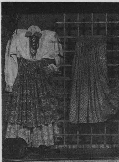
Fragment ekspozycji w Muzeum Regionalnym w Zamościu.

Placówką o odrębnym charakterze jest także muzeum w Chełmie stanowiące ośrodek muzealny o profilu humanistyczno-przyrodniczym. W muzeum tym obok działu historycznego i etnograficznego otwarto obszerną ekspozycję zawierającą okazy fauny i flory występujące na obszarze całego województwa. Dzięki wydatnej pomocy Muzeum Ziemi w Warszawie dział jest bogato wyposażo-