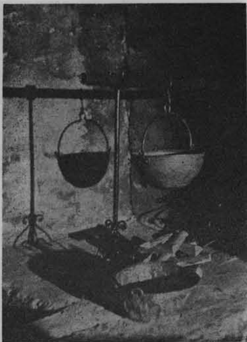
Fragment ekspozycji w Muzeum Regionalnym w Zamościu.

Nowo powstające placówki muzealne otrzymały istotną pomoc ze strony Muzeum Okręgowego, które konsultowało projekty statutów określające profil każdego muzeum oraz zakres jego działania w obrębie wytyczonych granic terytorialnych. Ponadto placówka okręgowa opracowała program organizacji działów specjalistycznych, uwzględniając specyfikę regionów.