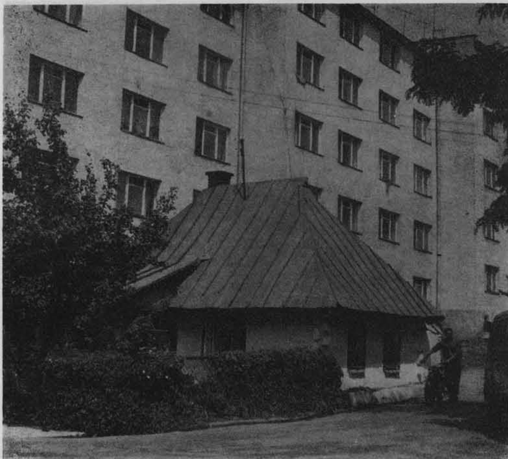
Rzeszowskie kontrasty — dom przedwojenny i domy zbudowane w okresie Polski Ludowej.

dykalny nurt Stronnictwa Ludowego. Do chlubnych kart historii ziemi rzeszowskiej należą dzieje tzw. Republiki Tarnobrzelskiej i powstania chłopskiego 1932 r. w powiecie leskim. W 1933 i 1937 r. demonstrowali w strajkach i manifestacjach ludzie pozbawieni pracy i ziemi. Na Rzeszowszczyźnie podpisana została Deklaracja Praw Młodego Pokolenia pozbawionego w Polsce przedwrześniowej perspektyw życiowych. W latach międzywojennych wielokrotnie strajkowali robotnicy fabryk „Polna” i „Cyklop” w Przemyślu, ciężkie boje klasowe toczyli robotnicy fab-