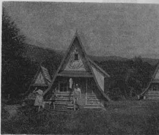
Zakładowy Ośrodek Wypoczynkowy w Wetlinie.

Ostatnie lata, a zwłaszcza okres od 1960 r. charakteryzuje się także systematycznym wzrostem ruchu turystycznego na pięknej ziemi rzeszowskiej. Oblicza