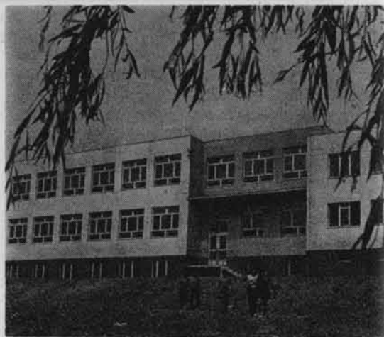
Nowa szkoła we wsi Brzozówka pow. Jasto.

Miarą zasięgu zachodzących przemian jest również liczba zelektryfikowanych wsi. W 1944 r. było tylko 15 zelektryfikowanych wsi, a w 1968 r. już 87% ich ogólnej liczby 6 . Rozwinęło się znacznie budownictwo wiejskie. W 1963 r. budowało się przeciętnie w województwie 3500 budynków mieszkalnych i 5000 budynków gospodarczych. Obecnie, dzięki długotermi-