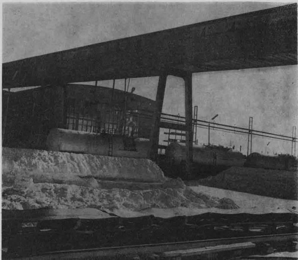
Tarnobrzeski Kombinat Siarkowy. Składowisko siarki w kopalni „Machów”.

świadczy m.in. struktura społeczna mieszkańców. W 1931 r. aż 79% ludności utrzymywało się z rolnictwa, którego poziom charakteryzują następujące dane: 41,3% gospodarstw wiejskich nie przekraczało wówczas 2 ha, 44,9% gospodarstw posiadało powierzchnię od 2 — 5 ha, a 11,7% — zajmowało powierzchnię od 10 — 15 ha 2 . Wydajność w podstawowych zbożach nie przekraczała 10 q z ha. Znikomy stopień uprzemysłowienia pogłębiał ogólne zacofanie tych terenów.