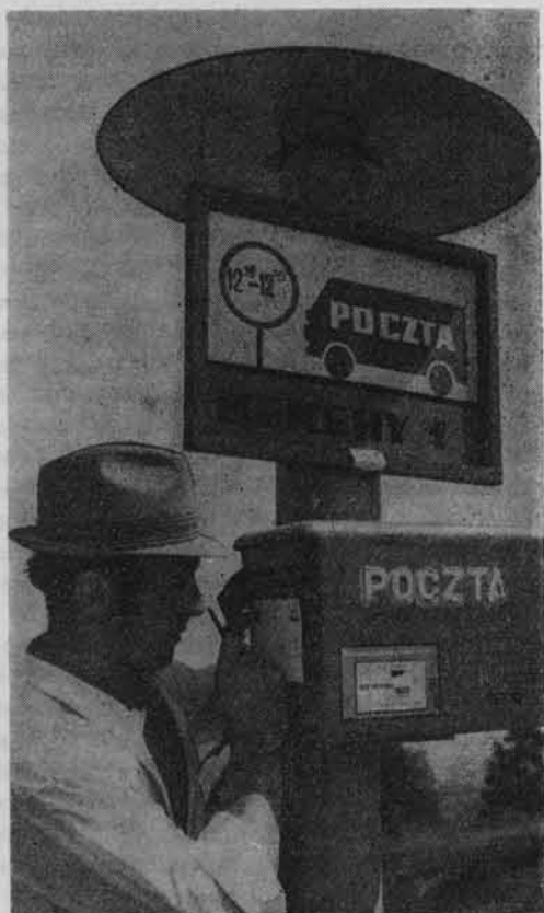
Z myślą o turystach uruchomiono w Bieszczadach pocztę samochodową.

W celu dalszego zabezpieczenia warunków dla rozwoju sportu i turystyki przewiduje się — zgodnie z założeniami Wojewódzkiego Programu Wyborczego — adaptację osiedla robotniczego w Solinie na ośrodek turystyczno-wypoczynkowy