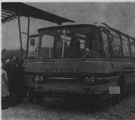
Nowy model autobusu „Autosan”.

Przemiany te są wynikiem intensywnego uprzemysłowienia ziemi rzeszowskiej. W oparciu o istniejące bogactwa oraz surowce mineralne (siarka, gaz, ropa naftowa, drewno, surowce ceramiczne) wybudowano nowe zakłady. Gruntownie zmodernizowane i rozbudowane zostały wszystkie istniejące zakłady przemysłowe. Pierwszą hutą, która podjęła pracę w Polsce Ludowej była właśnie huta „Stalowa Wola”. Dla frontu pracowały także kopalnie ropy naftowej. Pokojowa