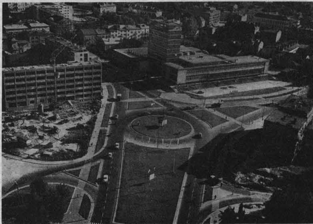
Centrum Rzeszowa, rok 1969.

Rzeszowszczyzna, ziemia o bogatej tradycji walk o narodowe i społeczne wyzwolenie, charakteryzowała się w przeszłości wieloma wspaniałymi zrywami rewolucyjnymi. Dość wcześnie rozpoczęły tutaj swą działalność Komunistyczna Partia Polski i Polska Partia Socjalistyczna. Znaczne wpływy posiadał na wsi ra-