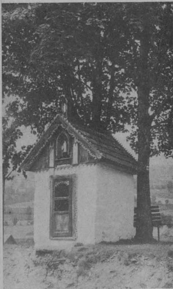
Kapliczka w Łomnicy-Zdroju w Beskidzie Sądeckim.

cię szczególną uwagę, jako że ich ujęcie jest nowe. Chodzi o problematykę wielkomięską oraz o problematykę wiejską. Są to niejako dwa bieguny zainteresowań krajoznawczych.