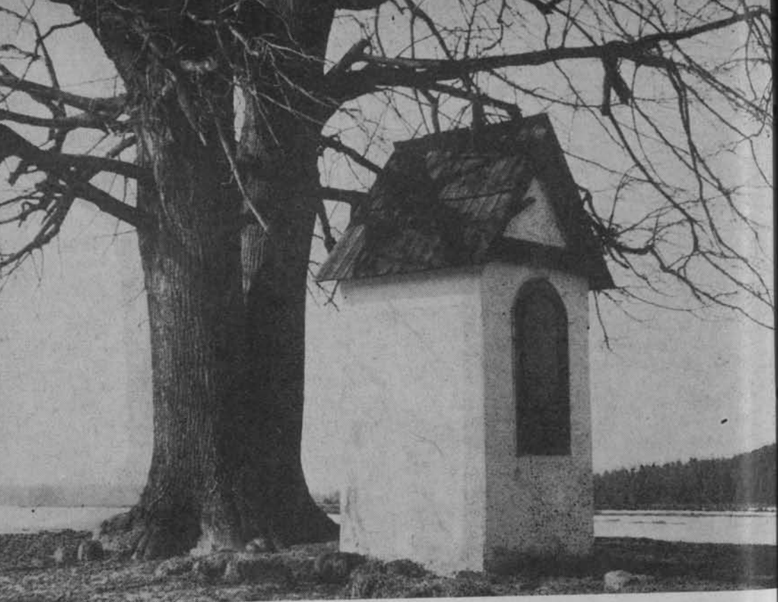
Kapliczka w Bańskiej Dolnej na Podhalu.