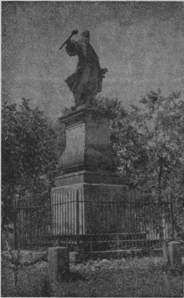
Tykocin, na którym skończyliśmy gawędę o wędrówce autora, chociaż on płynął dalej. Pomnik Stefana Czarnieckiego dłuta francuskiego rzeźbiarza Pierre'a Coudraya (1763)

duży rak należy w Złotorii do osobliwości”.