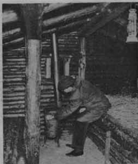
Wnętrze jednego z bunkrów na terenie skansenu.