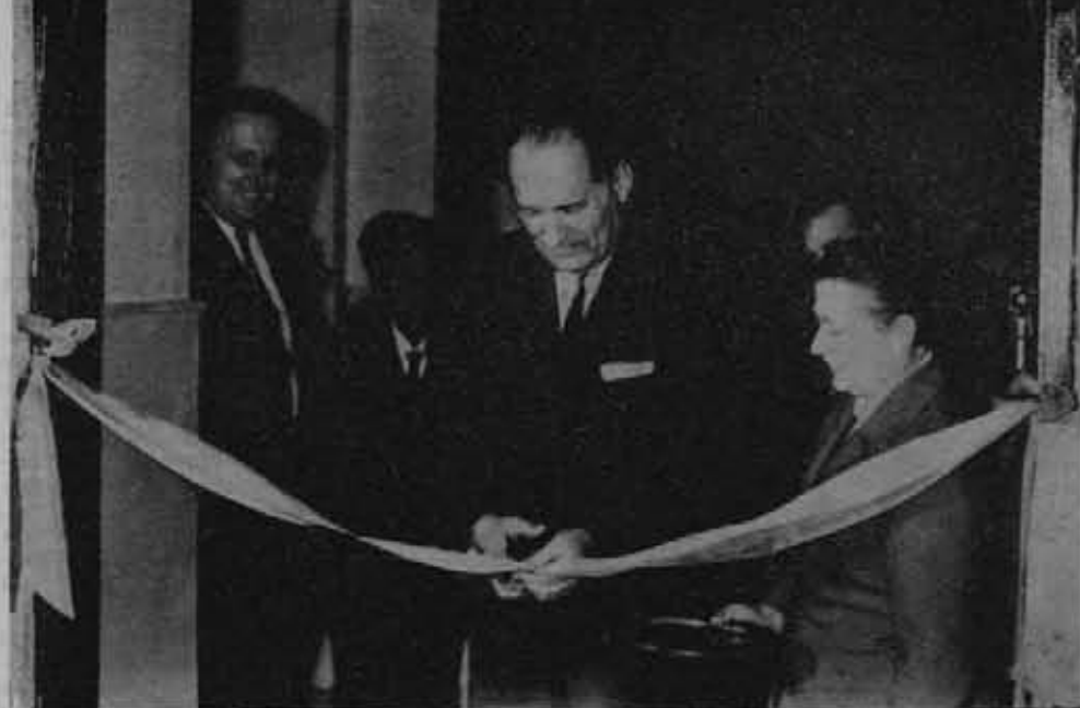
Zastępca członka Biura Politycznego, sekretarz KC PZPR Mieczysław Moczar otwiera wystawę „W trudzie i walce pokoleń”.