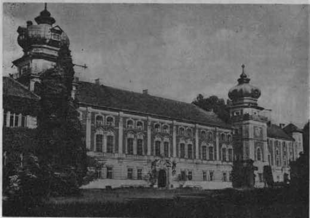
Łańcut. Zamek z XVII w.