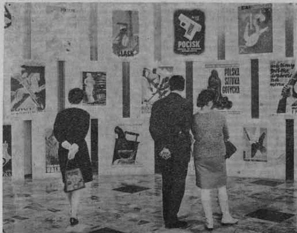
Fragment ekspozycji w Muzeum Plakatu w Wilanowie.

2. Dotychczas niesłusznie używano nazwy: z „Rusocina”.