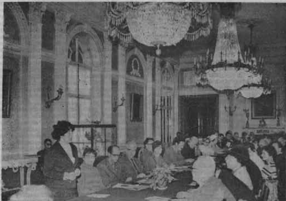
Sala obrad VI Krajowej Narady Aktywu Krajoznawczego.