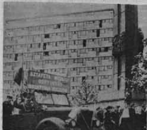
Sztafeta Szlakiem Zwycięstw wzdłuż Odry i Nysy na ulicach Szczecina.

Polskiego, prowadziła z Cheima Lubelskiego przez Lublin, Dęblin, Wartę, Płock, Toruń, Bydgoszcz, Piłę, Mirosławiec, Gorzów Wlkp. do Ślubic.