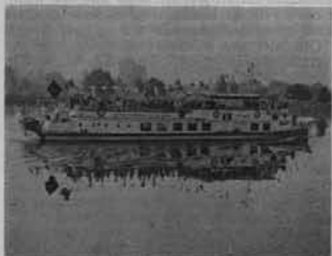
Statek „Agata” z uczestnikami Rejsu Przyjaźni Młodzieży NRD i Polski na Odrze.

W dniach od 27.VIII. do 3.IX.1968 r. odbył się V Rejs Przyjaźni studentów Polski i NRD po Odrze zorganizowany przez ZSP, ZMS, ZMW, TRZZ i FDJ (Wolna Młodzież Niemiecka). Trasa Rejsu prowadziła z Wrocławia do Szczecina.