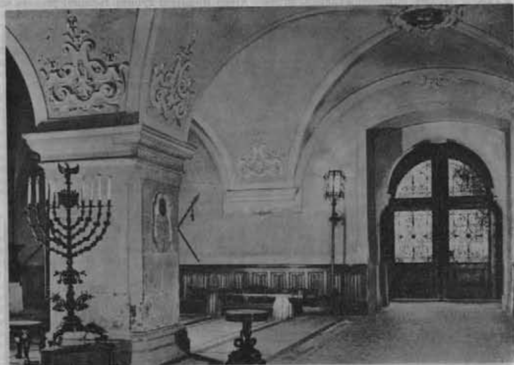
Łańcut. Sienk zamkowa — miejsce ożywionych dyskusji.

nę Mileską wynika, że praca krajoznawcza w Towarzystwie prowadzona jest w 17 Okręgowych i 166 Oddziałowych Komisjach, 309 przychodniach krajoznawczych i 689 punktach informacji. W okresie sprawozdawczym wygłoszono 2823 odczytów, których wysłuchało 129 199 osób. Wszystkie Komisje prowadziły akcję szkoleniową, czynnie włączały się do organizowanych w Okręgach, Oddziałach i kołach imprez turystycznych zabezpieczając im właściwą treść krajoznawczą. Niektóre Okręgowe Komisje wspólnie z regionalnymi towarzystwami naukowymi i kulturalno-oświatowymi organizowały sesje popularnonaukowe, konkursy krajoznawcze, fotograficzne, quizy i inne imprezy. Aktyw krajoznawczy opracowywał przewodniki, foldery, przeprowadzał inwentaryzację miejscowości, organizował sejmiki, zloty, konferencje krajoznawcze itp. Jedną z poważnych dziedzin pracy krajoznawczej było przewodnictwo, popularyzujące zwiedzane miejscowości, zakłady pracy i inne obiekty krajoznawcze, szerzące wiedzę o współczesnych zdobyczach w okresie Polski Ludowej.