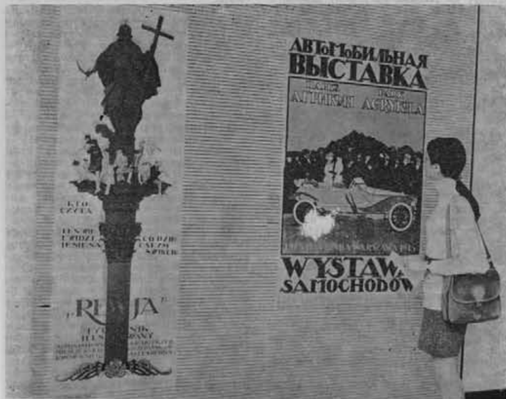
Fragment ekspozycji w Muzeum Plakatu w Wilanowie.

Z inicjatywy Instytutu Historii Kultury Materialnej PAN przystąpiono do prac mających na celu otwarcie Muzeum Wisły. W muzeum, którego siedzibą stanie się gmach sandomierskiego Collegium Gostomianum znajdzie się odkryty w dorzeczcu Wisły sprzęt używany przez rybaków i flisaków w różnych okresach historycznych, modele spichrzy zbożowych, statków i łodzi oraz interesujące okazy flory i fauny wiślanej.