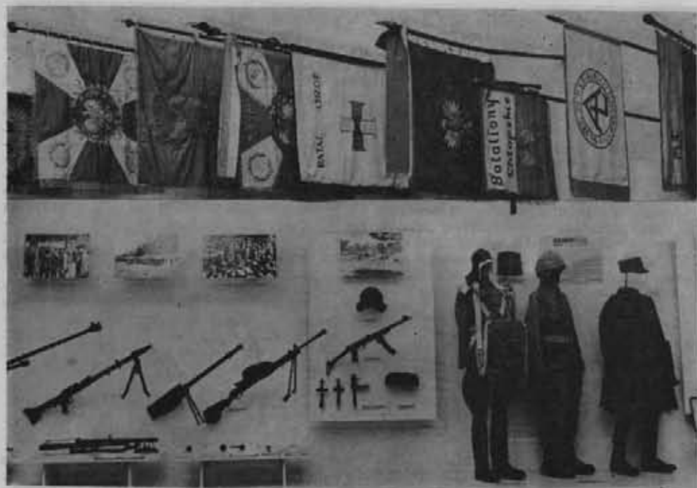
Fragment ekspozycji w Muzeum Wojska Polskiego w Warszawie.