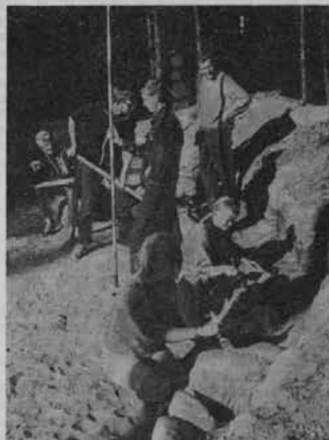
Grupa studentów przy pracy.

Staraniem Katedry Archeologii Polskiej Uniwersytetu Łódzkiego, Wojewódzkiej Rady Narodowej w Bydgoszczy i Zrzeszenia Studentów Polskich w sierpniu 1968 r. zorganizowano we wsi Odry (pow. choj-