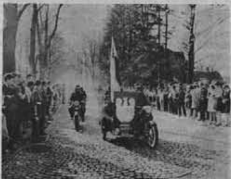
Powitanie sztafety Szlakiem Walk Armii Radzieckiej i Czechosłowackiej Armii Ludowej przez społeczeństwo Rabki.

Sztafeta III przebyła szlak wiodący wzdłuż Nysy Łużyckiej i Odry — Granicy Pokoju, z Bogatyni przez Lubań, Żagań, Zieloną Górę, Międzyrzecz, Siekierki, Pyrzyce do Szczecina.