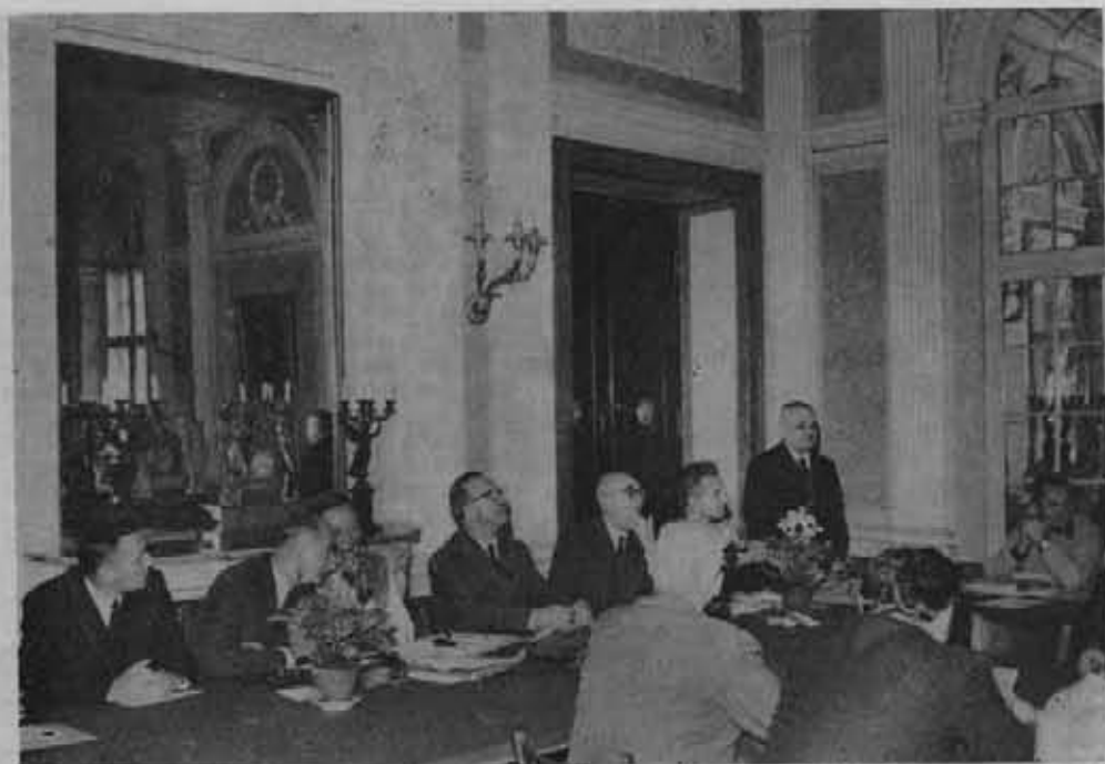
Prezydium obrad VI Krajowej Narady Aktywu Krajoznawczego.