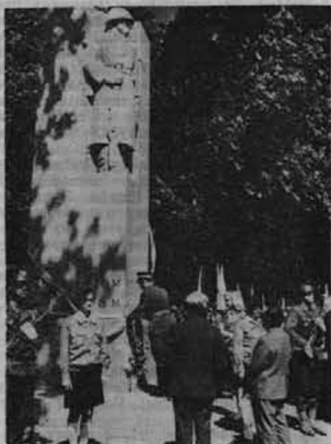
Moment odsłonięcia pomnika przez wiceministra Obrony Narodowej, generała broni Grzegorza Korczyńskiego.