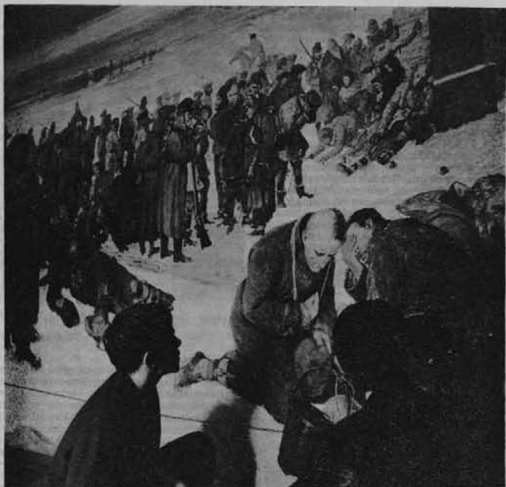
Przed obrazem Aleksandra Sochaczewskiego „Pożegnanie Europy”.