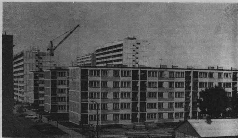
Nowe osiedle mieszkaniowe Staszica w Lubinie.

Na terenie powiatu działa kilka środowiskowych organizacji: Towarzystwo Miłośników Ziemi Lubińskiej, Ukraińskie Towarzystwo Kulturalne, Międzypowiatowy Korespondencyjny Klub Młodych Pisarzy. Z towarzystwami tymi PTTK łączy dobra współpraca.