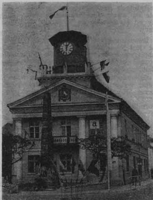
Siedziba MRN w Koninie.

na stopniowo wkraczać na tereny pokopalniane pierwszej w historii węgla konińskiego odkrywki „Morzysław”.