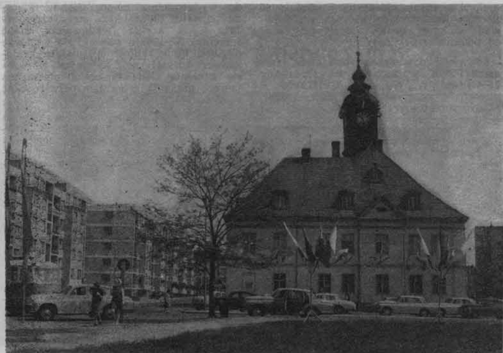
Zabytkowy ratusz w stolicy polskiej miedzi — Lubinie.

Na terenie podregionu lubińskiego znajduje się wiele interesujących zabytków. Należą do nich m. in.: