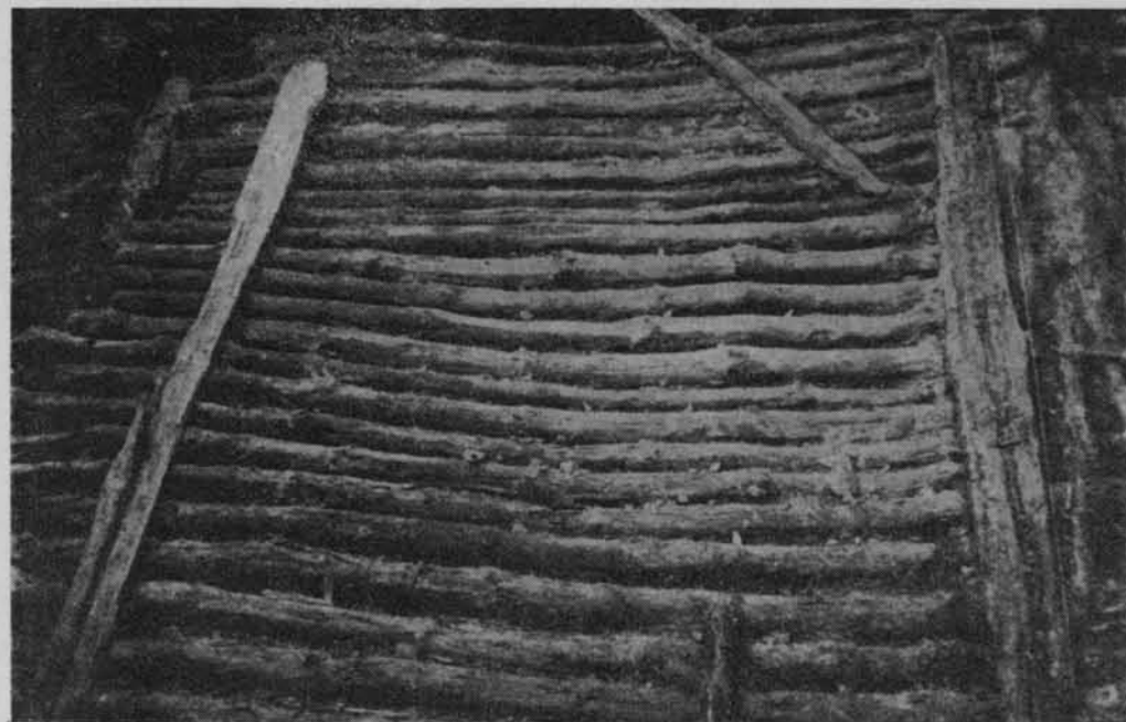
Wykopaliska w Koziegłowach — grodzisko kultury łużyckiej