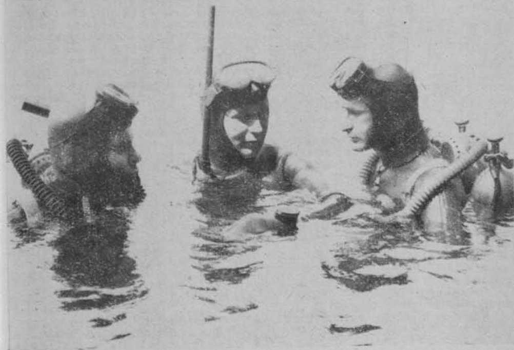
Ostatnia narada zespołu przed zanurzeniem.