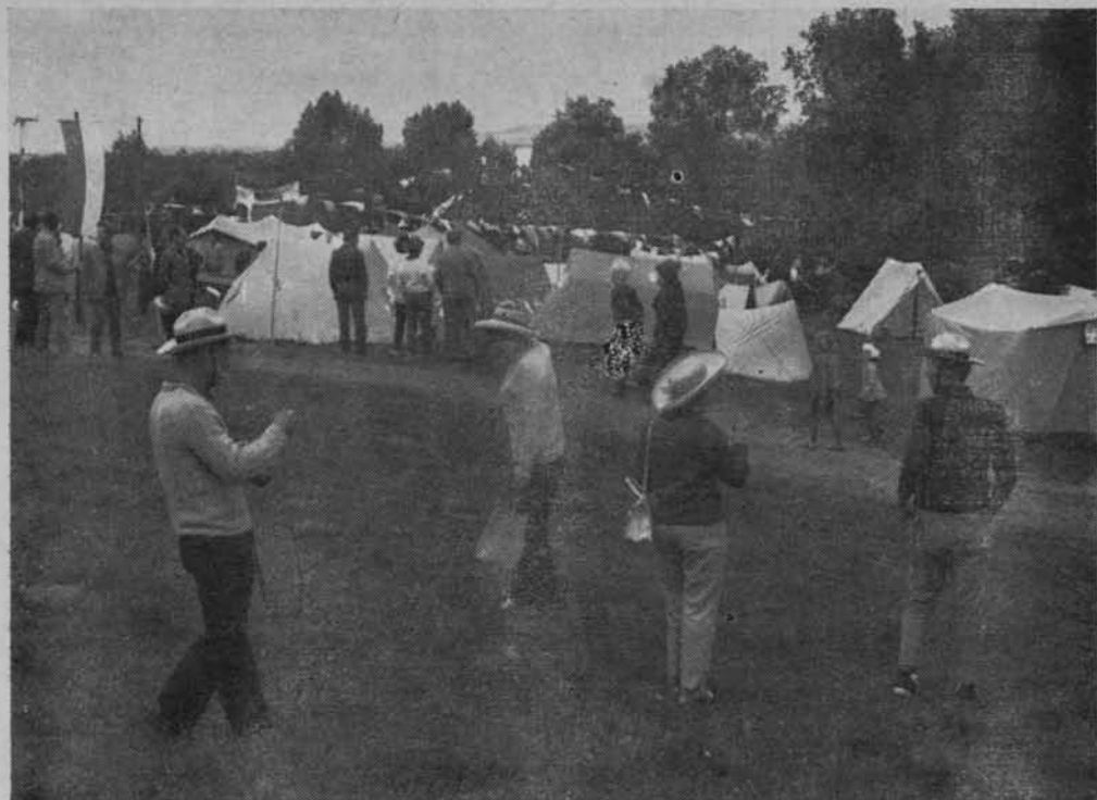
Miasteczko zlotowe.

swą wiedzę o osiągnięciach tego regionu w okresie powojennym.