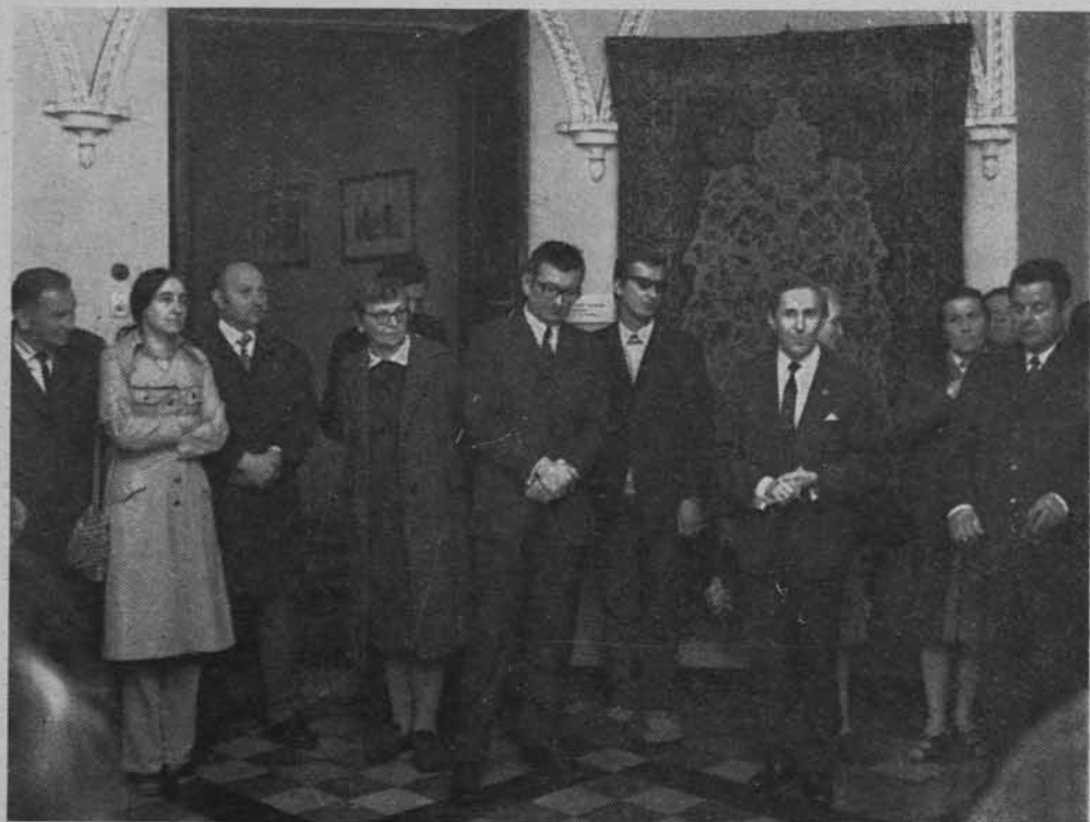
Otwarcie wystawy w Muzeum Regionalnym PTTK w Puławach.

Obrady w Sali Receptyjnej ratusza otworzył referat przewodniczącego Komisji Włodzimierza Antoniewicza na temat roli komisji opieki nad zabytkami