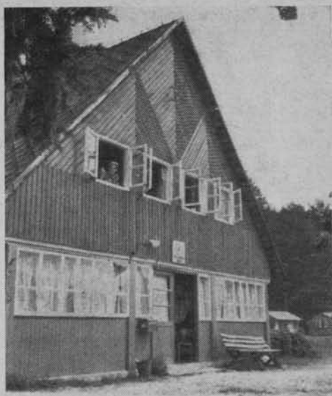
Stacja wodna PTTK we Frąckach.

W woj. zielonogórskim opracowany został program adaptacji i wykorzystania zabytkowych budynków dla potrzeb turystycznych. Przeprowadzone zostaną remonty 20 pałaców i dworców użytkowanych przez PGR, odrestaurowuje się lub odbuduje 157 zabytkowych