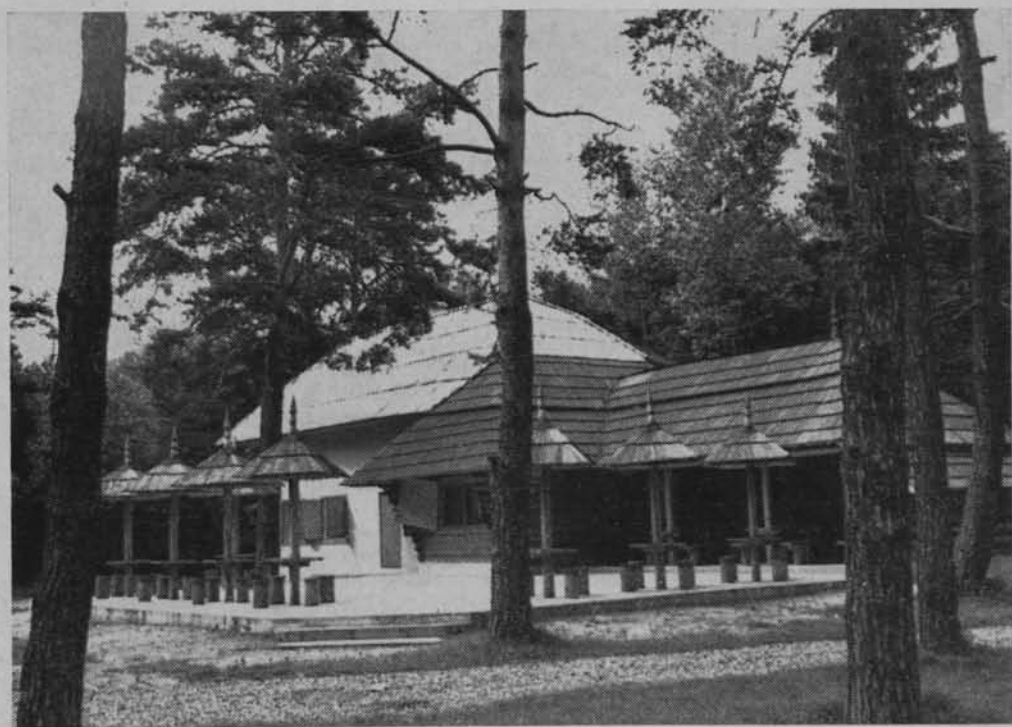
Bar Szalas przy drodze z Nowego do Starego Sącza.

Równocześnie na terenie województwa znajduje się wiele miejscowości o znakomitych walorach krajoznawczych i wypoczynkowych mających stosunkowo dobrą bazę turystyczną, które jednak są turystycznie wykorzystywane w stopniu niezadowalającym. Przeprowadzone ostatnio badania bazy turystycznej województwa wykazały, że ponad 360 miejscowości w województwie, zamieszkałych przez blisko 40% ludności województwa, można zaliczyć do turystycznych ze względu na walory przyrodnicze, krajobrazowe itd. Oznacza to, że prawie połowa ludności województwa może osiągać bezpośrednie korzyści ekonomiczne z turystyki — znaj-