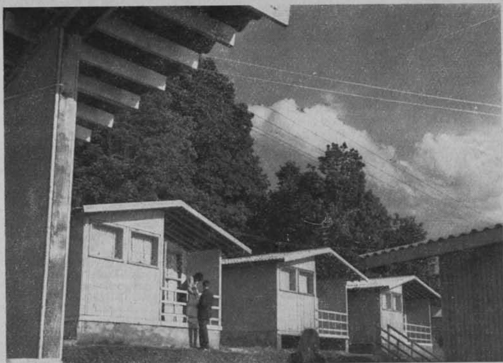
Nowoczesny ośrodek wypoczynkowy.

nio otwarto nowy ośrodek w tysiącletniej Wiślicy (pow. buski), gdzie nad Nidą urządzono kąpielisko, wybudowano przystań i pomieszczenie dla placówek handlowych. W urządzaniu ośrodka pomagali pracownicy miejscowych zakładów pracy.