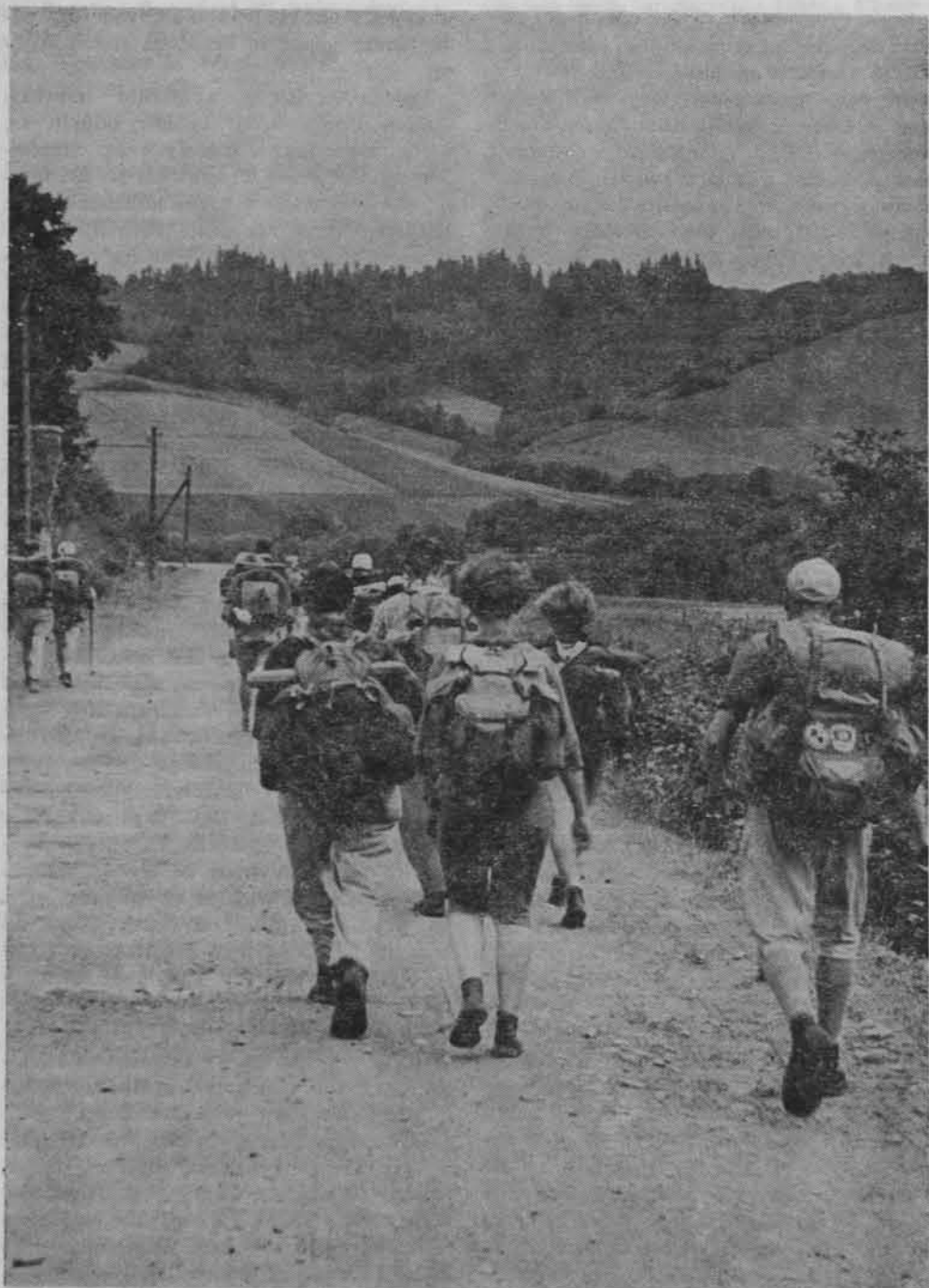
Chyba i dziś umiemy tak jeszcze wędrować, jak turyści z Oddziału PTTK zakładów „Cegielskiego” w Poznaniu w 1959 r.