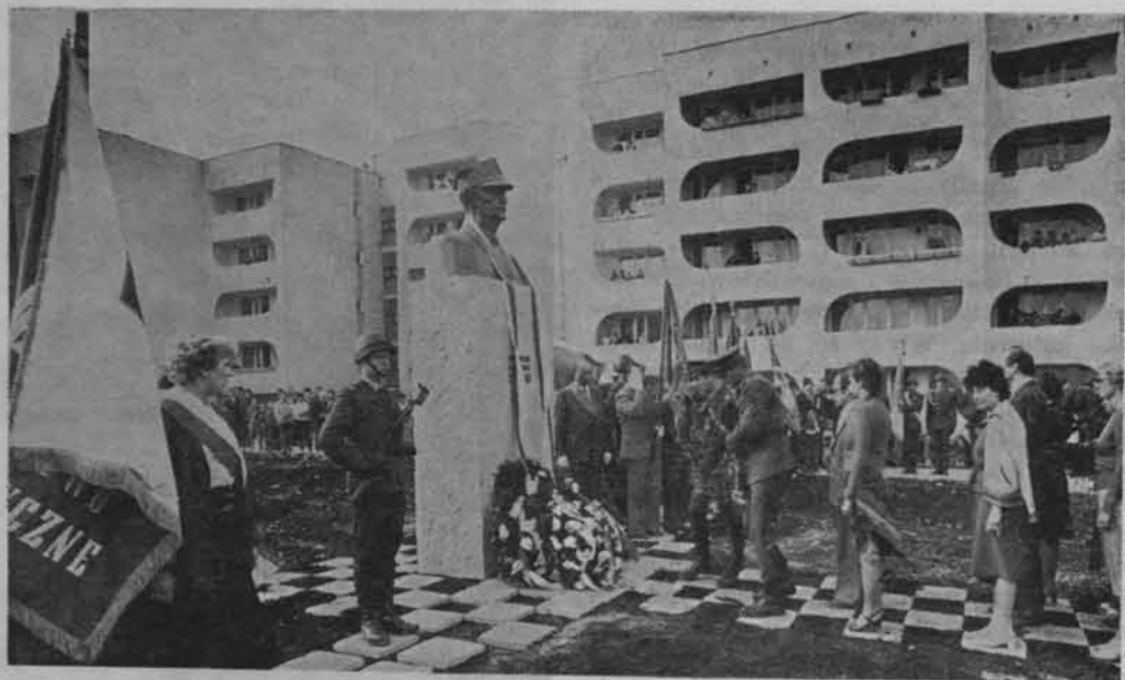
Pomnik gen. Władysława Sikorskiego w Chelmie, na osiedlu, któremu nadano Jego imię.

nika „Chwała Saperom”. Wokół pomnika utworzono skwer z ziemi przywiezionej z Palmir i pobliskich miejsc bitew. W przyszłości obok pomnika stanie tablica z nazwiskami poległych.