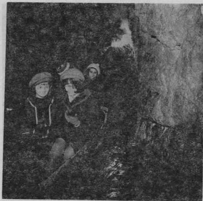
Wycieczka szkolna podczas przejażdżki lodzią w Sztolni Czarnego Pstrąga w zabytkowej kopalni ołowiu i srebra w Tarnowskich Górach.

Schronisko „Na Słęży” i „Pod Wieżycą” dla Oddziału Wrocławskiego PTTK. Dwa schroniska dolnośląskie; „Na Słęży” i „Pod Wieżycą” w Sobótce wróciły do PTTK. Władze terenowe we Wrocławiu przekazały je w wieczyste użytkowanie Towarzystwu, zaś prezydium Zarządu Głównego PTTK przeznaczyło obydwa obiekty w administrację Oddziałowi Wrocławskiemu PTTK, pierwotnemu gospodarzowi schronisk.