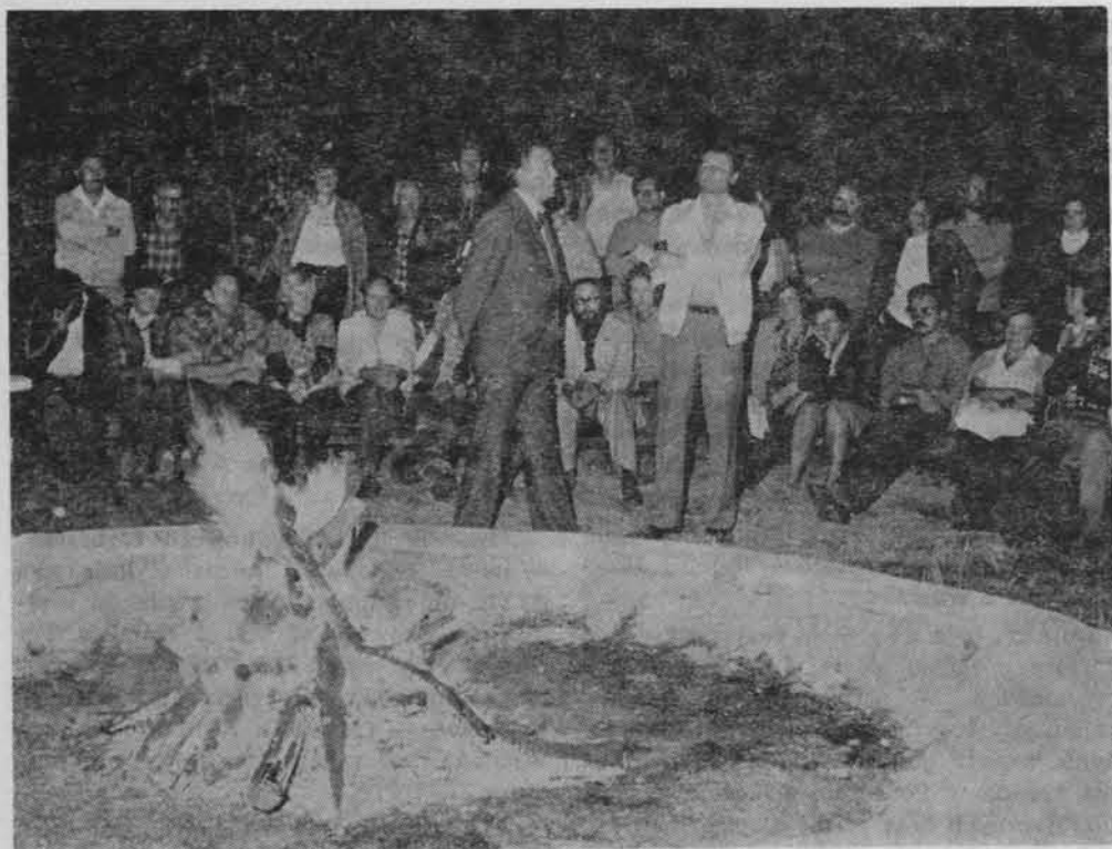
Ognisko podczas XII Centralnego Zlotu Aktywu Krajoznawczego PTTK w Szczecinie (CZAK'82).