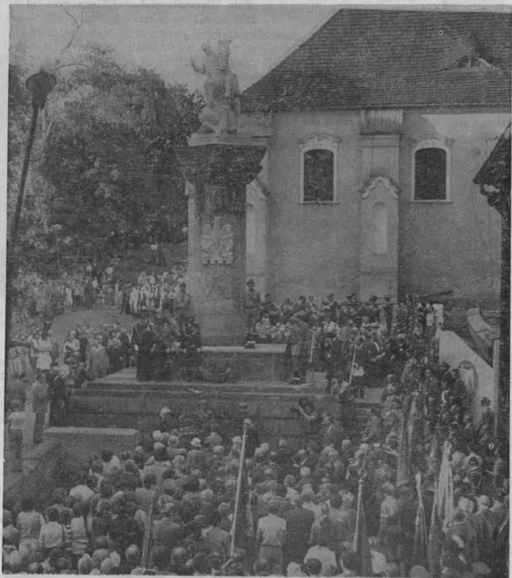
Zrekonstruowany w 1982 r. pomnik 15 pułku ułanów poznańskich, zwany potocznie pomnikiem ulana, przy ulicy Ludgardy na Górze Przemysława w Poznaniu.

łaczką społeczną, bojowniczką walki o wyzwolenie społeczne, a także członkinią lwowskiego stowarzyszenia abstynenckiego.