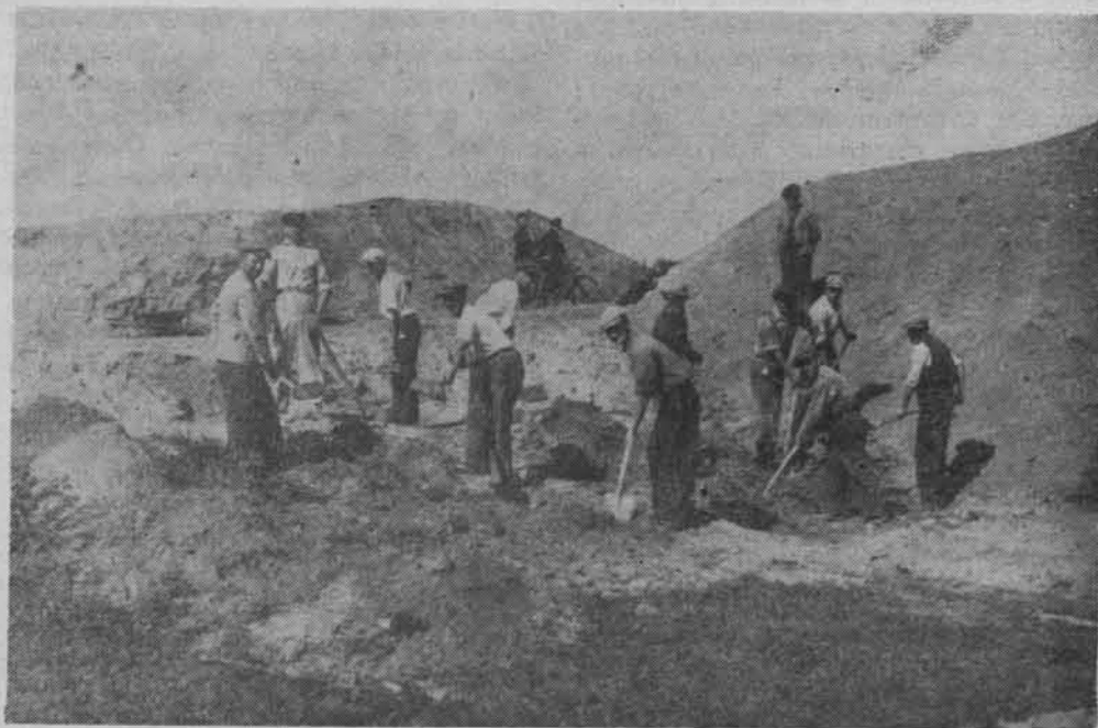
Budowa wałów przeciwpowodziowych w 1938 r.

Po regulacji Wisły rozwinął się na niej ruch parowców, które holowały barki wypełnione towarami m.in. do nowo wybudowanej w 1882 r. cukrowni w Świeciu. Okazało się jednak, że pozostało jeszcze do uregulowania wiele spraw spornych.