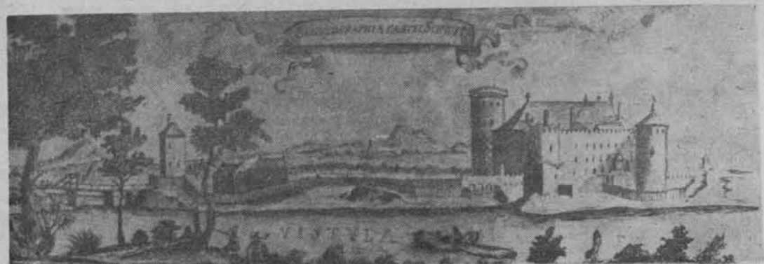
Panorama zamku wraz z mostem zwodzonym. Rycina z dzieła Samuela Puffendorfa wydanego w 1696 r. pt. De rebus a Carolo Gustavo Suedae rege gestis

kubówką. Ta była zawsze bardzo groźna. Kroniki podają, że już w 1379 r. miasto nawiedzone zostało przez powódź. Groźne powodzie odnotowano w latach 1445, 1540, 1674, 1711, 1745, 1813, 1816. Później powodzie zaczęły zdarzać się coraz częściej. W 1844 r. letnia powódź zniszczyła całkowicie 3 budynki, spowodowała zawalenie się