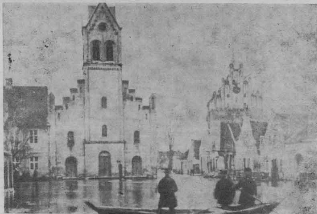
Powódź w Świeciu w 1876 r.

przeciw zamku znajdowała się Kępa Zamkowa. Zamieszkiwał tam mieszczanin świecki Piotr Bekier, który w lipcu 1663 r. zawarł umowę z komisarzem królewskim. Zgodnie z kontraktem zobowiązał się wyprodukować 1000 beczek popiołu szmelcowanego, który następnie miał być spławiony do Gdańska. Zamieszkiwało na wyspie 6 zawodowych rybaków. Kępa Żurawia była wyspą jeszcze w 1844 r. Na tej wyspie znajdowała się Kępa Wilcza. Miejska Kępa wzmiankowana w 1530 r. położona była naprzeciw miasta. Wymieniona była już w dokumencie lokacyjnym w 1530 r., dziś jest osadą wchodzącą w skład województwa toruńskiego o nazwie Ostrów Świecki. Wśród licznych wysp warto wspomnieć o Kępie Jedwabce i Kępie Krostkowej, wzmiankowanej w XVII w. „Położona o milę od miasta, a zamieszkiwali na niej Olendrzy”. Byli to uchodźcy z Holandii, którzy znaleźli w Polsce