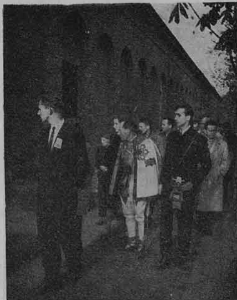
Turyści wiejscy zwiedzają cmentarz na Powązkach w Warszawie.