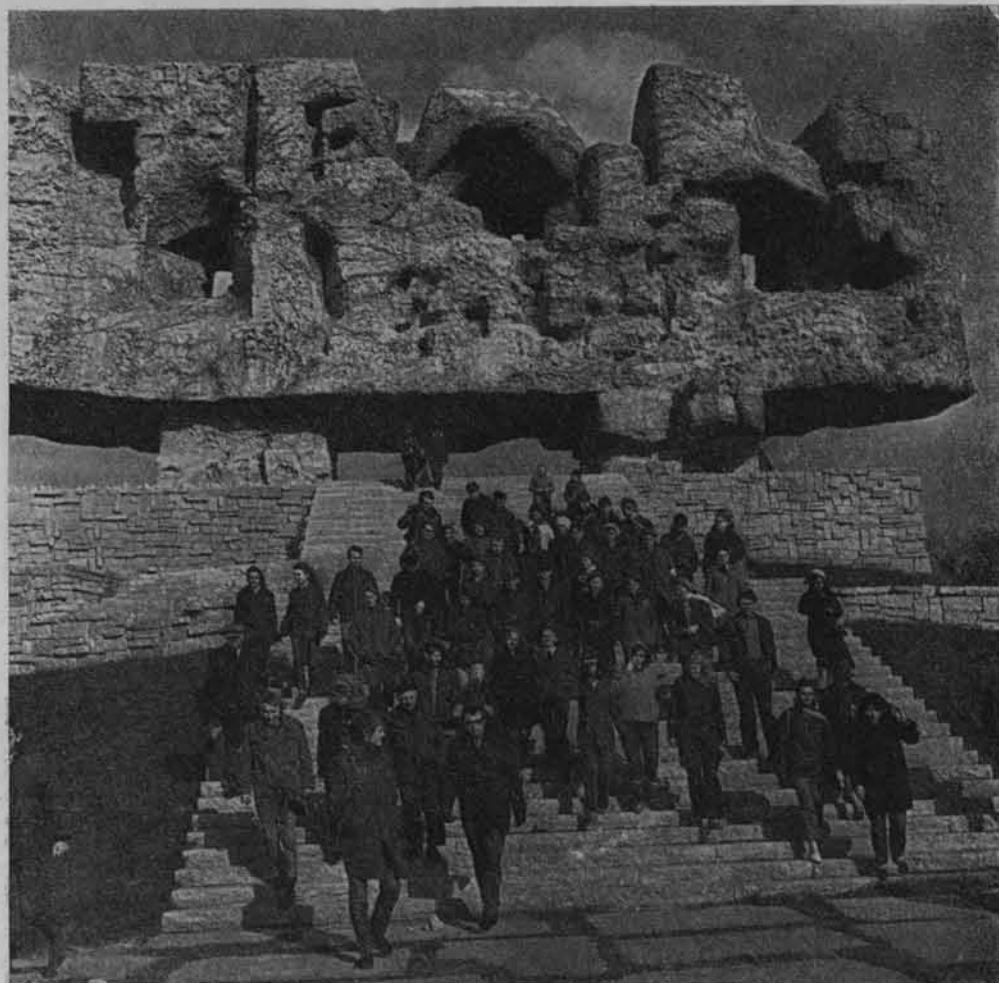
Na terenie dawnego obozu w Majdanku.