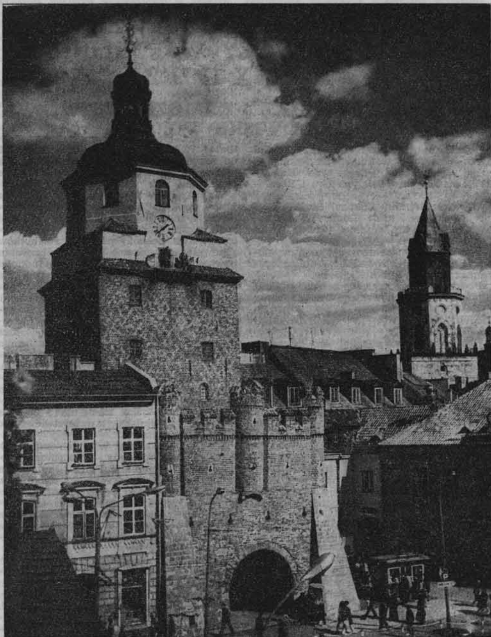
Brama Krakowska w Lublinie.