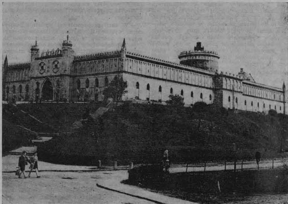
Zamek w Lublinie — miejsce martyrologii.