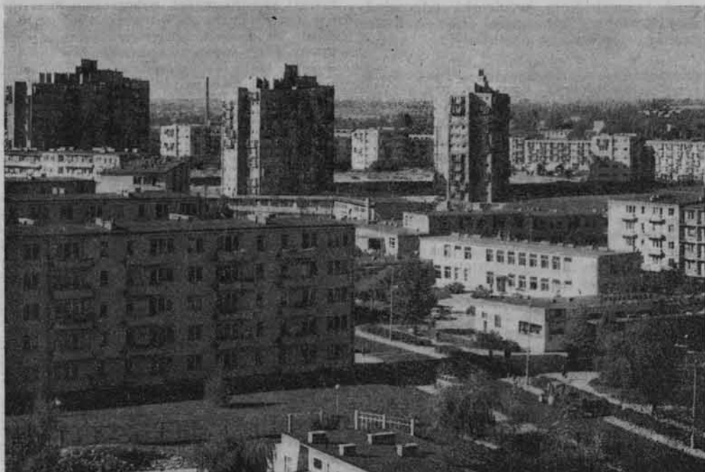
Nowe osiedle mieszkaniowe w Lublinie.