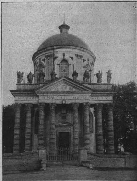
KOŚCIÓŁ W PODHORCACH. POW. ZŁOCZOWSKI.