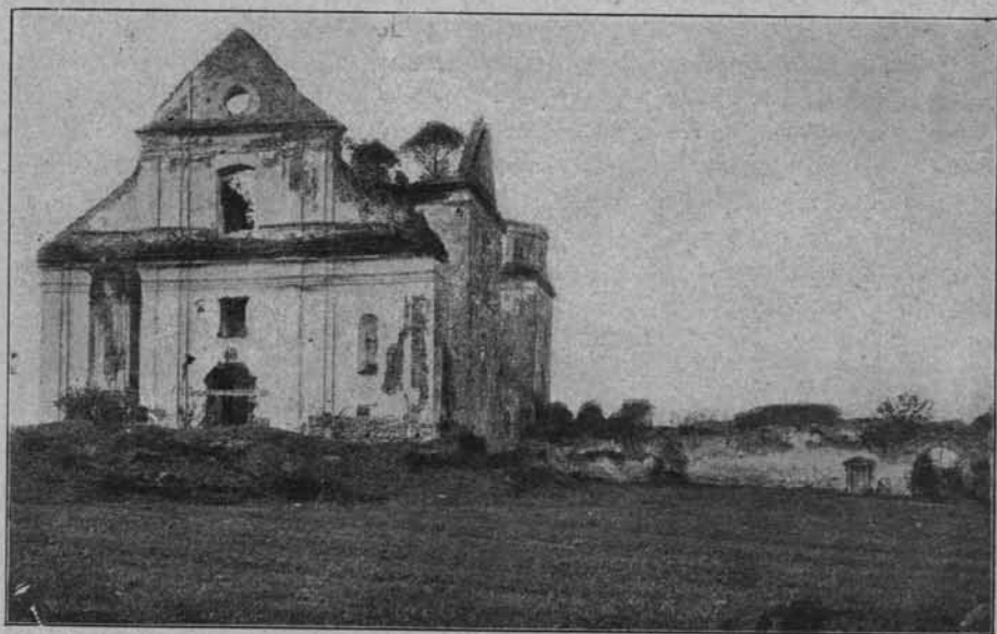
RUINY KLASZTORU W ZAGÓRZU, W POW. SANOCKI.