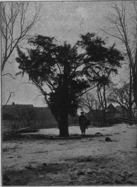
NAJWIĘKSZY CIS W POZNAŃSKIM (W GORAJU, POW. SKWIERZYŃSKI).

Wiekami wydrążonym, jakby w dobrym domie, Dwunastu ludzi mogło wieczerzać za stołem