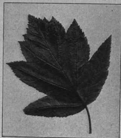
LIŚĆ GRUSZY MĄCZNEJ.

Drugim rzadkiem drzewem jest grusza mącznej.