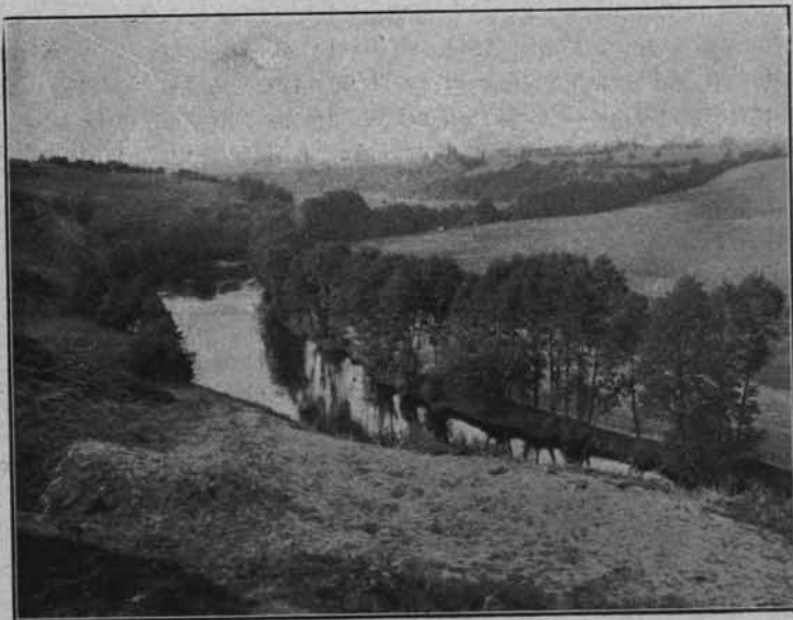
DOLINA BARYCZY NA POŁUDNIE OD KORONOWA.