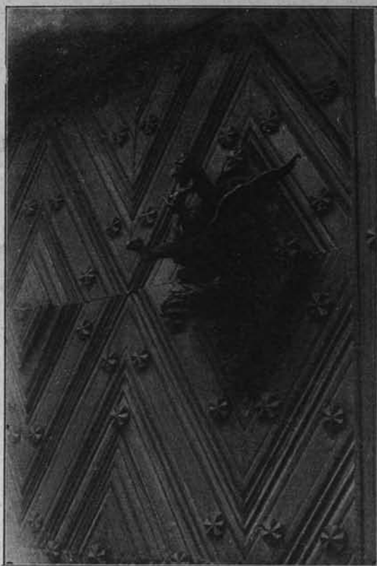
fol. St. Wojnas.

Do ubikacji parterowych prowadzą bardzo pięknie wykonane drzwi, nowszej roboty, ze