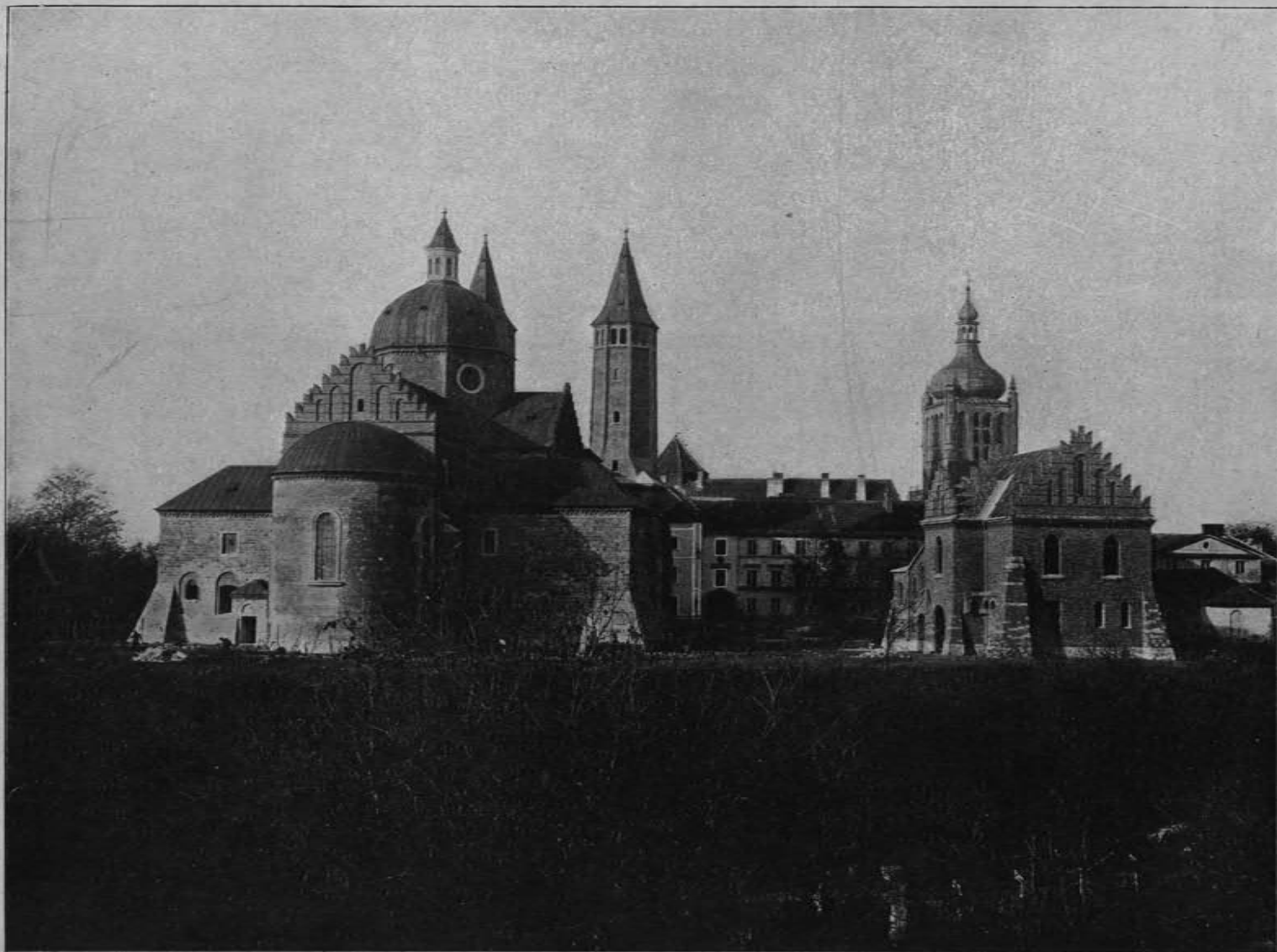
Zo zbiorów Pałak. Tascarz. Krajocz.