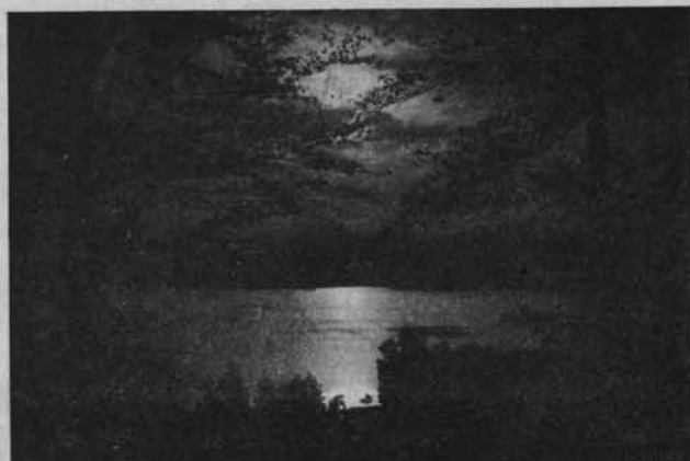
Ryc. 103 JEZIORO CHMIELNO NA POMORZU.

Potem p. Lewicki przedstawił budżet Rady, oraz sprawozdanie finansowe, zaznaczając, że Oddziały nie regulują ani dziesięciny, ani należności za „Ziemię”. Załedwie parę Oddziałów,