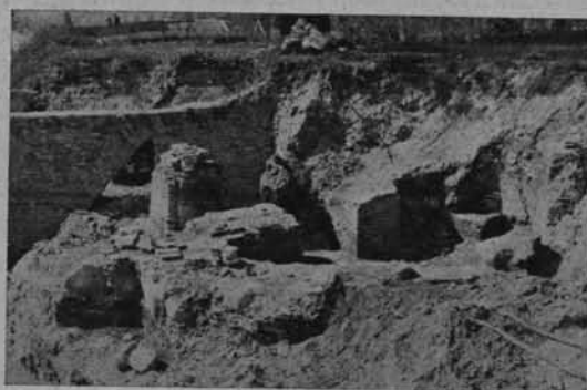
Ryc. 136. Grodno. Szczątki świątyni z XIII w. na zamku królewskim.