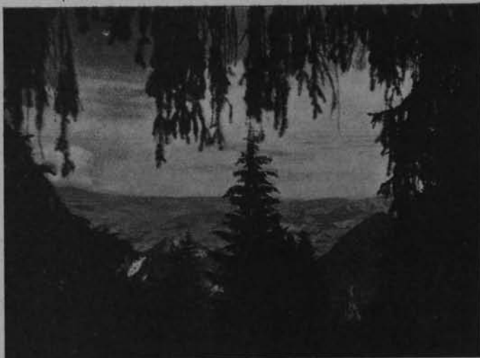
Ryc. 132. ✓