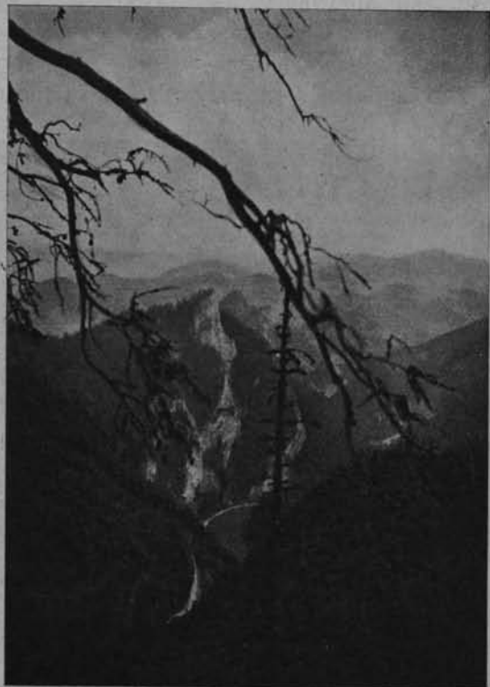
Ryc. 130. Pieniny. Dunajec pod Sokolicą.