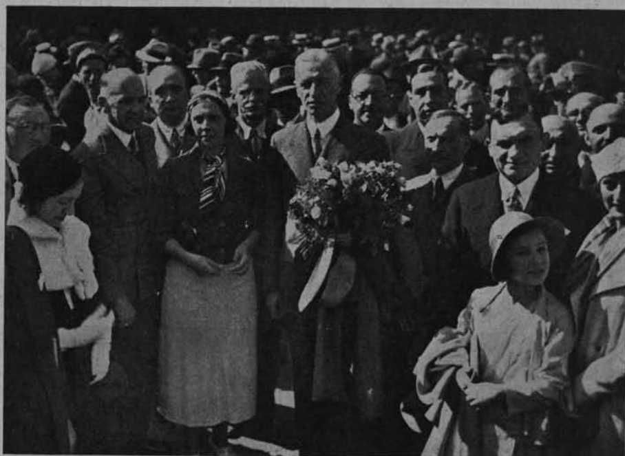
Ryc. 129. P. Marszałka Raczkiewicza witają w porcie Rio de Janeiro władze brazylijskie i kolonja polska.