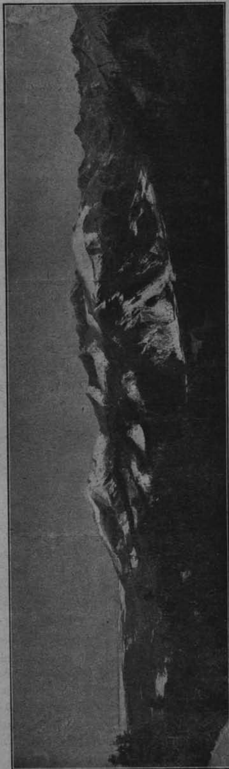
Ryc. 144. Jaworzyna

nicy górskiej, przeto tu właśnie, na terenie Jaworzyny, zyskują one szczególne znaczenie i powinny być uwzględnione tem więcej, że na całym pograniczu Polski i Czechosłowacji nie