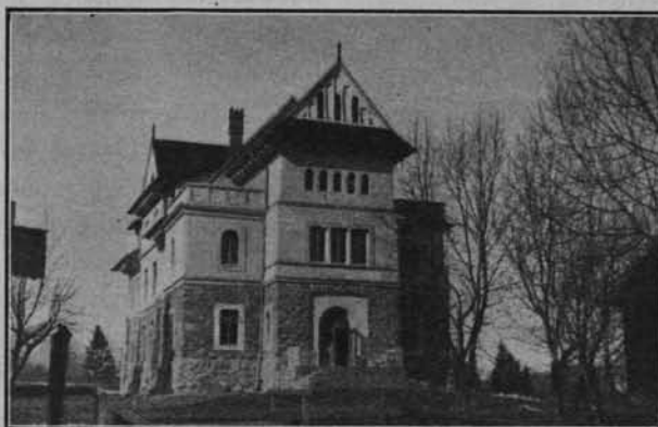
Ryc. 107. ZAKOPANE. MUZEUM TATRZAŃSKIE.

Tatry i Podhale, w ogólnem ujęciu terytorjalnem — to obszar działania Muzeum Tatrzańskiego. Na opracowanie dokładnych granic tych dwu pojęć, które należy zdefiniować pod względem fizjograficznym, etnograficznym i językowym, czekamy jeszcze i zapewne na wynik tych badań niekrótco jeszcze poczekać nam wypadnie. To jednak nie ulega i pewnie nie ulegnie wątpliwości, że Tatry i Podhale to nietylko odrębny od innych w Polsce kompleks fizjograficzny, ale że to również podłoże oryginalnego typu życia, na który decydujący o odrębności wpływ wywarło właśnie otoczenie; czyli że terytorjum to w istocie odpowiada pojęciu osobnego regionu. Zrozumiało ten fakt w r. 1889 nieliczne grono miłośników przyrody tatrzańskiej i ludu podhalańskiego, które w celu zobrazowania budowy i wyglądu Tatr, oraz uratowania jaknajwiększej ilości wytworów kultury i sztuki góralskiej, założyło „Towarzystwo Muzeum Tatrzańskie im. T. Chałubińskiego”. Słuszność wyboru Zakopa-