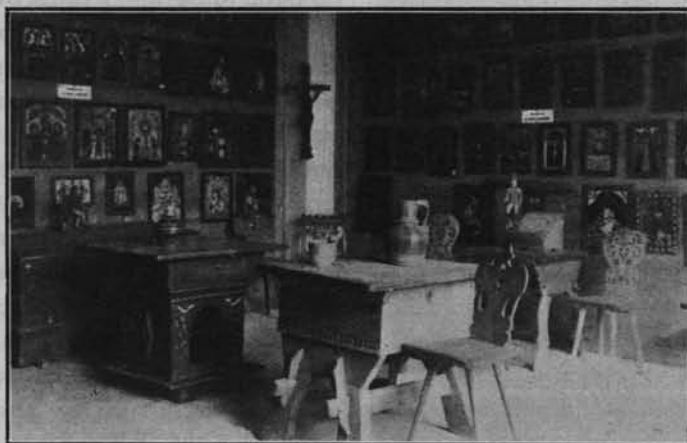
Ryc. 108. MUZEUM TATRZAŃSKIE. ZBIÓR OBRAZÓW NA SZKLE.

A właśnie instytutem naukowym, nietylko instytucją oświatową i propagandową, jest Muzeum Tatrzańskie, jak nim zostać winno każde muzeum regionalne w Polsce. Nie