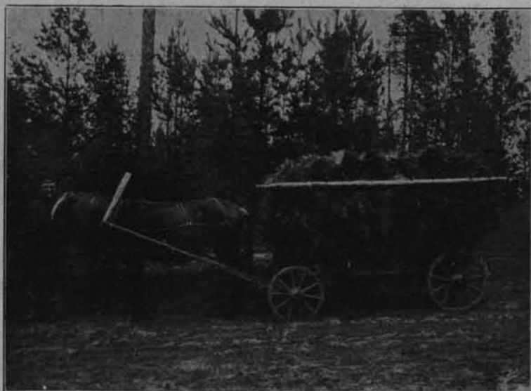
fol. W. Szukiewicz.