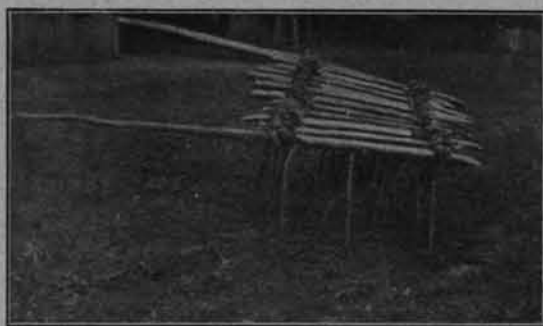
fol. W. Szuklewicz.