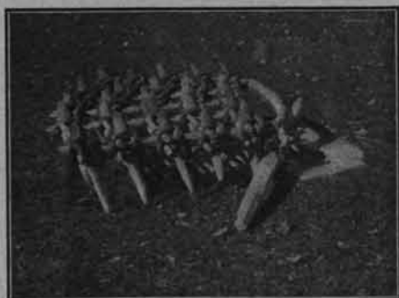
fol. W. Szuklewicz.

Daje się to zauważyć zwłaszcza w dziedzinie gospodarstwa rolnego. Są okolice, jak np. koło Pucilkowicz, Małych Dolców i in., gdzie dzięki wpływom dworów, włościanin dawno już przeszedł na płaską orkę, orze pługiem Sucheniego i używa bron wrzesińskich, a nawet sprężynówek 1) . Obok tych jednak, spotykamy nieraz narzędzia tak pierwotnych typów, o jakich gdzieindziej już od wieków zapomniano. Weźmy np. używaną tu jeszcze przez wielu gospodarzy małorolnych bronę, jak przedstawiona na załączonej rycinie. Jest to t. zw. po miejscowemu „smyk“, zrobiony z rozłupanych na połowę wierzchołków młodych świerków, powiązanych ze sobą w rząd tak, że nieobcięte gałązki są skierowane w dół i grają rolę zębów. Po bokach dwa dłużej obcięte wierzchołki i gładziej oskrobane, stanowią holośle do wprzęgnięcia w nie konia. Można twierdzić napewno, że skoro człowiek przedhistoryczny uznał potrzebę zastąpienia używanej uprzednio do zabronowywania zasiewów zwykłej, byle jakiej gałęzi, narzędziem, któreby tę rolę spełniało dokładniej, wówczas wynalazł właśnie taki „smyk“. W działaniu „smyk“ podobno jest bardzo dobry, zwłaszcza do wybronowywania ziemniaków, no i jest bańecznie tani, co wszystko zapewnia mu długie jeszcze lata używania. W porównaniu ze „smykiem“ drewniana broną litewska, złożona z dębowych