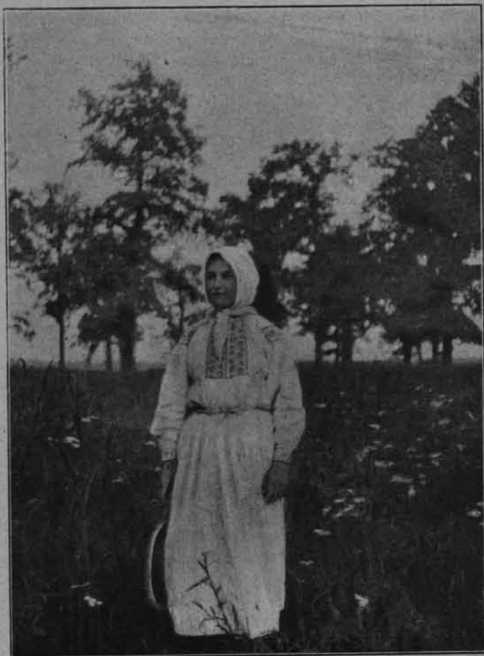
fol. J. hr. Dunin-Karwicki. DZIEWCZYNA Z OKOLIC POLONNEGO (WOŁYŃ).

Ile można krzewić wiedzy przez siły miejscowe, rok sprawozdawczy dokładnie stwierdza. Częstochowa np. miała odczyty o Śląsku Austriackim, o Wilnie, o zabytkach budownictwa w Polsce, Chełm — o przeszłości ziemi chełmskiej, lecnictwie ludowym, półwyspie Helskim, Grójec — o ziemiach polskich, Kalisz — ziemi polskie pod względem geologicznym, o puszczy białowieskiej, Kielce — Litwa — ludzie i bogi, baśń ludowa słowiańska, Kujawy — o zwie-