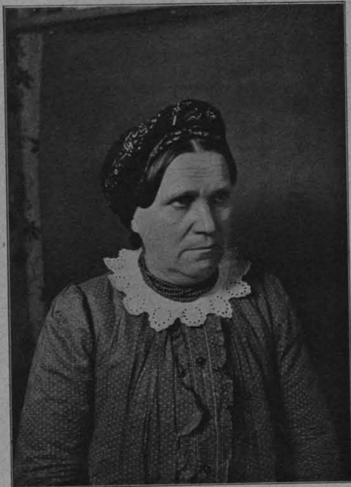
WŁOŚCIANKA Z PODBUSKA.