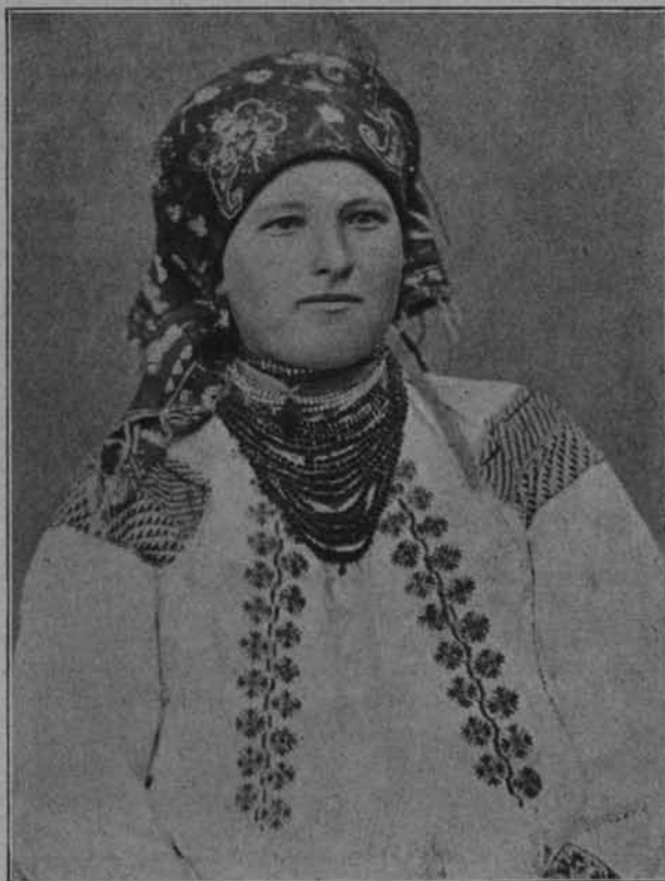
fol. ze zb. Pol. Tow. Kr.

W psychologii ludów, zarówno jak i w życiu duchowym każdej jednostki, walka dobra ze złem jest głównym podkładem fantazy i twórczości. Mitologia, ta nauka, która od tysięcy lat rozwija się, zmienia, kształtuje, a mimo to bynajmniej nie wychodzi poza ramy tego, czem była u ludów starożytnych, opiera się głównie na owej walce. Powstają całe zbiory legend, wierzeń, podań, klechd, baśni i przysłów, w których wcielenie bóstwa dobra lub zła w najrozmaitszy występuje sposób. Wrodzone człowiekowi dążenie do prawdy zmusza go do wnikania w najgłębsze tajniki natury; powstaje filozoficzne pojmowanie, roztrząsanie psychologiczne — jak to widzimy na wschodzie, gdzie często zwycięża żywioł etyczny, a u niektórych ludów wprost nie pozwala doprowadzić do rozdwojenia; u innych znów sprzyja rozwojowi dualizmu, usamowolnia dwie wrogie, równoznaczne sobie potęgi zła i dobra. Takim pozostanie ten dualizm aż do naszych czasów w literaturze, gdzie „dyabeł” będzie symbolem wszystkiego, co się sprzeciwia prądom etycznym, wskaźnikiem wielkiej walki indywidualnej. To też w literaturze wzrośnie on do takiej po-