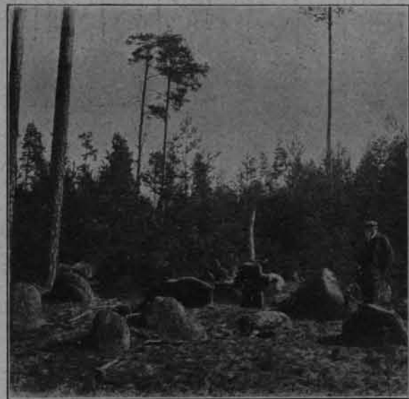
CMENTARZYSKO W OSIECISZCZU.

Kończąc na tem ten szkic pobieżny, muszę wspomnieć jeszcze o ciekawych cmentarzach tu-