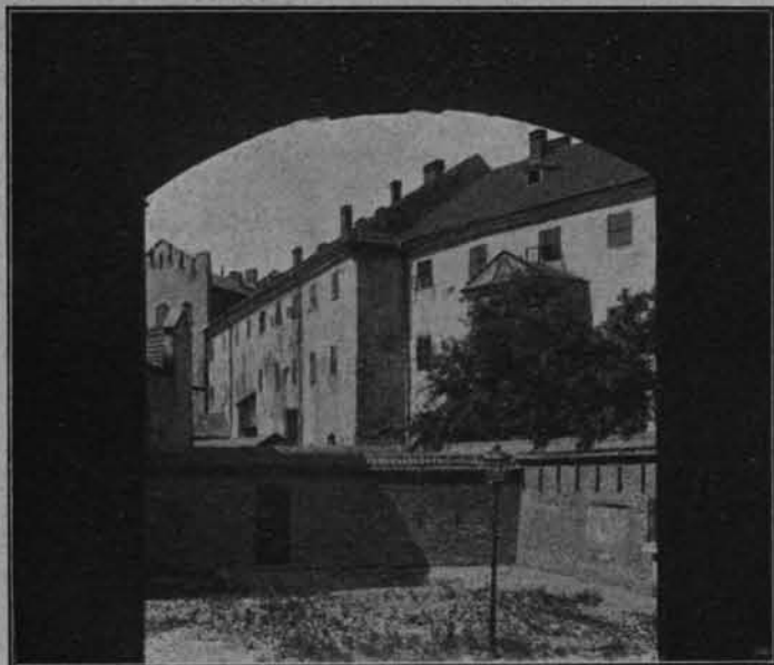
fol. S. Warchołik.

W pismach, wystosowanych w r. 1891 i 1892 do Rady miejskiej, podnosi ono potrzebę założenia muzeum w wieży ratuszowej, na wzór nowo zakładającego się muzeum we Lwowie. Sprawa ta jednak na razie upadła, tak wówczas jak i później w r. 1896, ze względu na wydatki, jakie pociągnęłoby za sobą tworzenie osobnej instytucji. Dopiero w r. 1898 wchodzi ona ponownie na porządek dzienny, postawiona we właściwym świetle, kiedy świeżo założone Towarzystwo miłośników historii i zabytków Krakowa oświadcza się za założeniem muzeum, ale nie jako osobnej instytucji lecz przy Archiwum, które już rozpoczęło zbieranie zabytków i stworzyło podstawę dla muzeum. Tak postawiona kwestya spotkała się z przychylnym przyjęciem tak Magistratu jak i Rady miejskiej. Wybrana do tej sprawy osobna komisya, złożona z radców