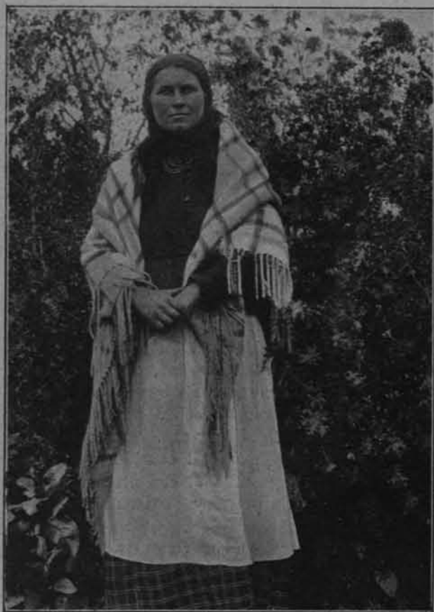
GOSPODZYNI Z ZABUŻA (POW. ZAMOJSKI).