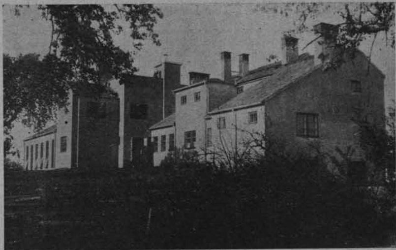
Ryc. 172. Stacja Hydrobiologiczna na Wigrach.—Widok od strony jeziora.

badaczy do zapoznawania się dokładnego z właściwościami chemicznymi, fizycznymi wody i dna zbiorników słodkowodnych, przeprowadzenia dokładnych badań geologicznych i geograficznych niezbędnych do zrozumienia pochodzenia i budowy badanego zbiornika.