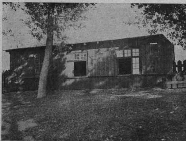
Ryo. 174. Stacja Hydrobiologiczna nad jeziorem Kiekrskim.

nologicznych oraz wcale dobrze zaopatrzoną bibliotekę specjalną i wybitnego uczonego jako kierownika, to dojdziemy do przekonania, że stacja wigierska staje w rzędzie najlepiej urządzonych, najbardziej przystosowanych do obecnych wymagań nauki słodkowodnych stacji w Europie. Naturalnie nie można uważać, że urządzenie stacji jest już całkowicie ukończone. Stacja wymaga jeszcze pewnych nakładów pieniężnych, które w pierwszym rzędzie winny być zużyte na dokończenie mieszkalnego domu dla przyjezdnych pracowników naukowych, któryby pozwolił na jednoczesne przebywanie na stacji 20 osób przyjezdnych. Sprawa ta jest bardzo ważną, gdyż od niej uwarunkowana jest możliwość urządzania kursów wakacyjnych dla nauczycieli, studentów wyższych uczelni oraz rybaków. Niezbędne jest też zakupienie nowego motoru dla łodzi motorowej, gdyż obecnie pracujący już jest bardzo zużyty. Bardzoby się też przydało zakupno łodzi przenośnej oraz pompy planktonowej. Uzupełnienie biblioteki stacyjnej wymagałoby też jednorazowej większej dotacji. Wobec życzliwego stosunku do stacji kierownictwa funduszu kultury narodowej i Wydziału Nauki Ministerstwa Oświaty oraz niezmordowanej planowej pracy obecnego kierownika stacji można żywić nadzieję, że stacja na Wigrach, rozwijając się w dzisiejszym tempie, przodować będzie swoją pracą i urządzeniami między podobnymi instytucjami światowemi. Naukowa działalność stacji zawarta jest w kilkudziesięciu cennych pracach z różnych dziedzin limnologii, dr-