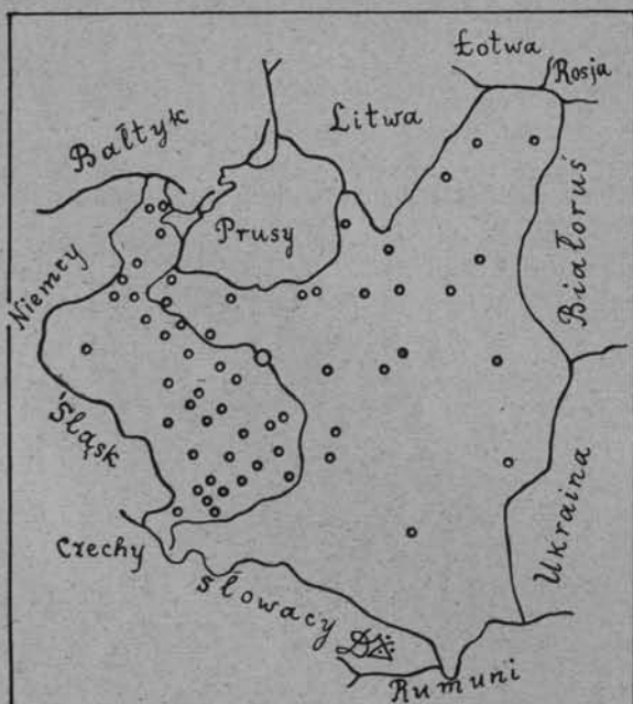
Nasza Plejada. Rozmieszczenie oddziałów P.T. K. do VII. 1919 r. według rocznika i Ziemi. Ryc. 178.