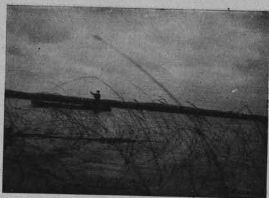
Ryc. 222. POLESIE. RYBAK NA STRUMIENIU.

Moroczno do Starych Koni nad Styrem — około 40 km.