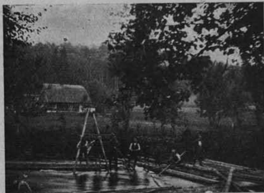
Ryc. 224. TLEŃ NAD CZ. WODĄ.

Za czasów niemieckich powstał projekt, aby ów kamień sprowadzić do Świecia i wystawić pomnik Bismarkowi. Jednakowoż odstąpiono od tego zamiaru, ponieważ transport tego kolosa nastroczał wielkie trudności. Niemcy, jak