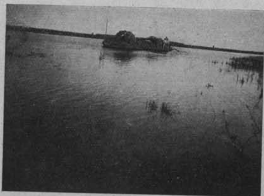
Ryc. 221. POLESIE. „DUB” Z DRZEWEM NA STRUMIENIU.

Na poznanie tych wszystkich osobliwości wystarczy parę godzin. Potem łodzią — przepięknymi odnogami Stochodu, pośród ścian sitowia, trzciny, oczeretu, dzikiej mięty — przejazdka dwugodzinna do Woli Bereznej — wodą około 10 km. (łędem prawie 40!). Stąd na