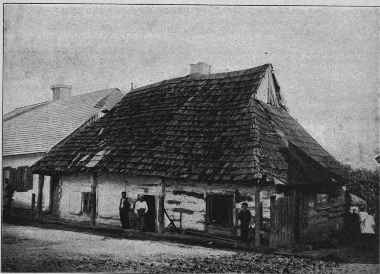
fol. ze zb. Pol. Tow. Krajocz.