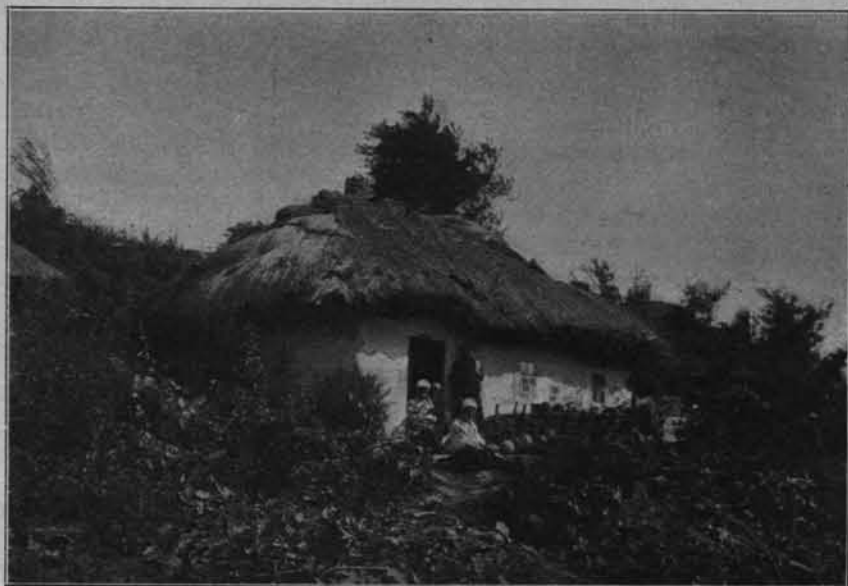
CHATA UKRAIŃSKA (pow. rzyszczowski)