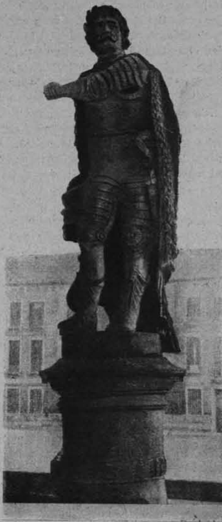
POSĄG JANA SOBIESKIEGO W PADWIE.

Tak więc kultura polska wiele zawdzięcza prastarej uczelni, słusznie więc na katedrze Galileusza wśród wieńców hołdu jubileuszowego widnieje też wieńiec o biało ponsowych wstęgach z napisem: Polonia.