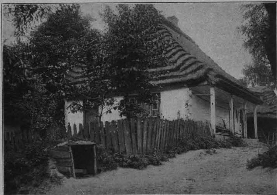
CHATA LUBELSKA (z Urzędowa, pow. janowski)

organizator tego zakładu, rozwinął niesłychaną energię: odbudował łazienki, hydropatyę i domy mieszkalne, — na pałacu wznosił drugie piętro i wieżę ciśnień, wznosił kilka pomniejszych nowych budynków gospodarskich, oczyścił staw, przeprowadził wodociąg. W roku następnym stanęły: