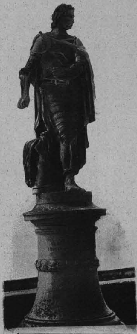
POSĄG STEFANA BATOREGO W PADWIE.

swą zawartość, a liczne parowce, greckie, dalmackie, tureckie, stwierdzają dawne tradycje weneckiego handlu na Lewancie.