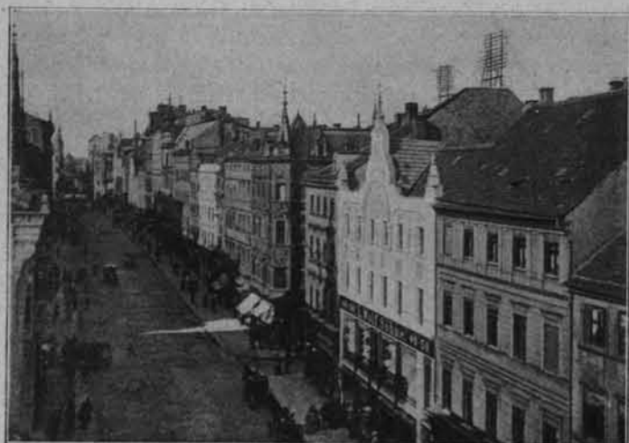
ULICA SZEROKA W SZCZECINIE.