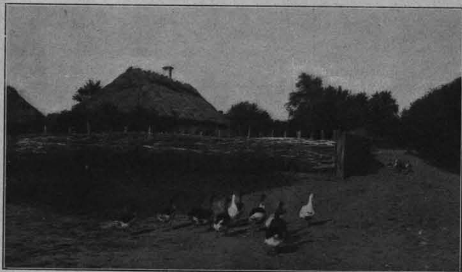
ZAGRODA PODOLSKA (pow. winnicki)

Wyborem Nałęczowa kierowały nie tylko małoletnia miejscowość i tradycja dawniejszego