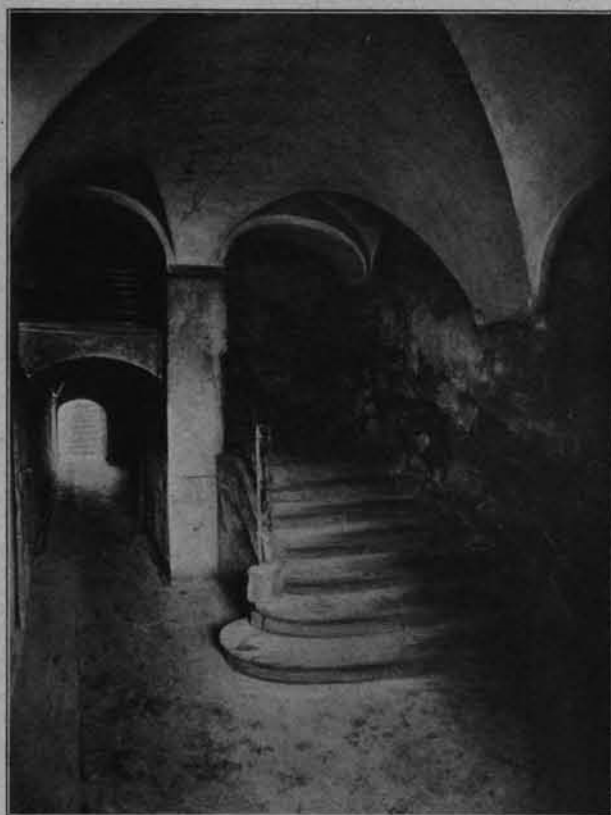
SIEN DOMU „A” 40 W RYNKU STAREGO MIASTA W WARSZAWIE.